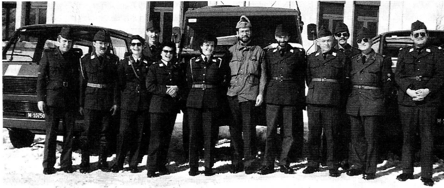
Winterwettkampf Andermatt 1991

wohnheit gewordenen angenehmen und «süßen» Überraschung.