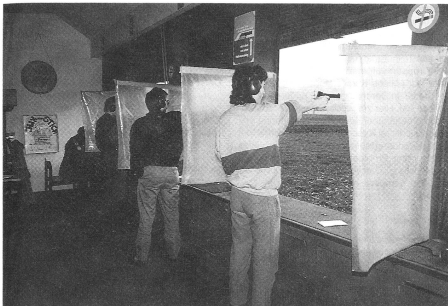
Ein kombattanter Sektionspräsident!

Einen ersten Höhepunkt und zugleich eine kleine Verschnaufpause war zweifellos das Pistolen-Kleinkaliberschiesen. Im Pistolenstand Au massen sich die Gruppen in einem kleinen Wettkampf. Auch die Übungsleitung liess es sich nicht nehmen, ihre Treffsicherheit unter Beweis zu stellen.