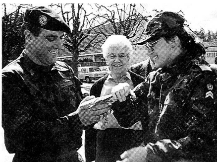
«Begegnung»: Besuchstag der RS 4 in Liestal am 6. 4. 1991; Werbung für den MFD.

Eine weitere Aufgabe unseres Verbandes bestand in der Werbung für den Frauenhilfsdienst. So organisierte der Vorstand 1954 eine Werbekampagne in verschiedenen Gemeinden des mittleren und oberen Baselbietes. Der Zeitaufwand war gross, die Werbeabende gut besucht, die Anmeldungen jedoch gering.