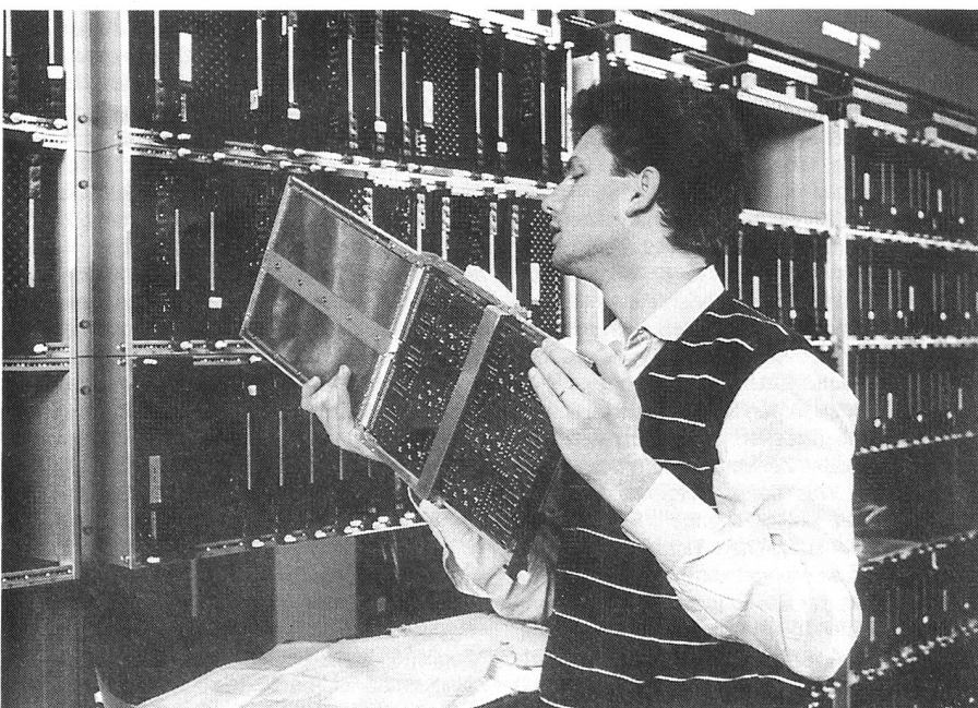
Le système de commutation moderne S12 d'Alcatel STR est prêt pour l'introduction de Swissnet 2. Ainsi, l'automne 1992 fera date dans l'histoire des télécommunications suisses: un seul raccordement permettra à chaque utilisateur de connecter jusqu'à huit appareils terminaux à son choix dont deux pourront fonctionner simultanément, qu'il s'agisse d'un appareil téléphonique, d'un télécopieur, d'un ordinateur personnel, etc.

Office fédéral des troupes de transmission Section planification, 3003 Berne