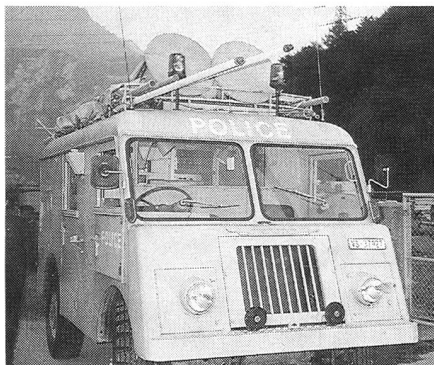
Une vue du Mowag-radio aménagé par la CE-CA. Un air de déjà-vu pour un pionnier radio...

Pour avoir participé en tant qu'observateur à cet exercice catastrophe d'envergure, je me suis aperçu que le plus difficile était de coordonner les divers moyens radio ou de communication. Chaque instance qui intervient a son canal radio mais est reliée aux autres au moyen du canal K. Bien vite ce canal K devient saturé. D'autres moyens non prévus entrent en jeu comme par exemple le Natel C. Plusieurs personnes, dont des journalistes, ont utilisé ce moyen qui a permis de pallier certains problèmes de «bousculade» radio.