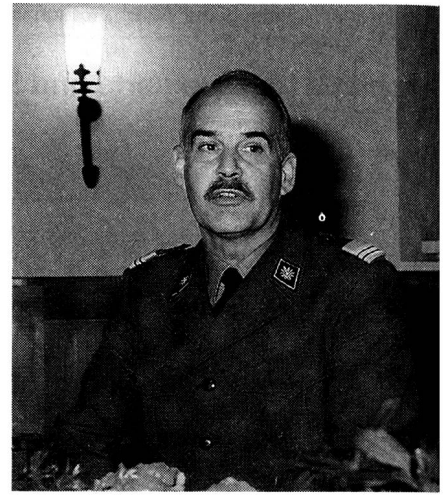
Ausführungen des Schulkommandanten und der weiteren Redner.