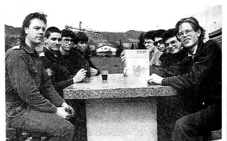
Man zeigt sich auf dem Titelblatt des PIONIER.