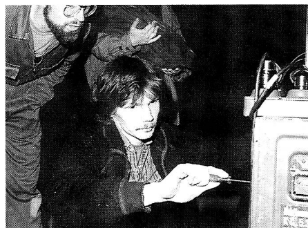
FTK: «Die Konfiguration des MK-5 ist aber auch kompliziert!»

gen, die aus besagtem Telefon erklangen, zu folgen und so den nächsten Telefonmasten zu besteigen, schon eher. Aber auch diese Aufgabe meisterten die B-Kurs-Absolventen mit links und kamen so zu den Koordinaten des letzten Postens. Zum Abschluss wurde dort noch Leitungsbau unterrichtet, danach ins EVU-Hüsli zurückverschoben, wo die Übung mit einem Abendessen und gemütlichem Beisammensein beendet wurde. Hoffentlich konnte den B-Kurs-Teilnehmern mit dieser Übung ein guter Einblick ins vielfältige Vereinsleben gegeben werden, so dass sich vielleicht der eine oder andere zum Beitritt entschliesst. MIKE