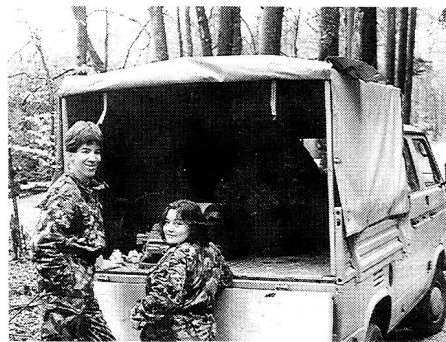
prima '92: Wann klappt endlich diese Fernschreiberverbindung?

von der die Kurslehrer schon lange hinter vorgehaltener Hand getuschelt hatten, konnte über die Runden gehen. Nach dem Fassen von TAZ und Regenschutz ging es auch schon mit einer kurzen Befehlsausgabe im EVU-Hüsli los. Mittels VW-Bussen wurde dann in den Schiessstand des Armbrustschützenvereins Neuhausen verschoben. Dort angelangt, gab es einen Kurzkurs im Kabelsplessen, nachher noch einen kleinen Ambrust-Schiesswettbewerb. Weiter ging's in Gruppen zu Fuss, im leichten Nieselregen. Am ersten Posten wartete ein Bus mitsamt SE-430, TC-535 und STG-100 auf die Gruppen; es galt, die Koordinaten des nächsten Postens per Fernschreiber zu erfragen. Nichts einfacher als das, aber «denkste»! Irgendwo sass das Fehlerteufelchen und lachte sich krumm, und bis die erste Gruppe die Koordinaten hatte und weiterzog, warteten bereits schon alle anderen Gruppen vor dem Posten. Am zweiten Posten galt es wiederum, die Koordinaten des nächsten Postens zu erfragen, diesmal aber über Funk. Der dritte Posten hatte es dann in sich. Ein Feldtelefon an zwei aus einem Verteilerkasten heraushängenden Kabel anzuschliessen, war nicht schwer. Den Anweisun-