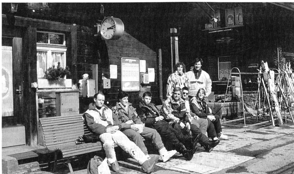
Das EVU-Skiteam lässt sich die Sonne auf den Bauch scheinen

Am 2. und 3. April 1994 fand das Skiweekend des EVU Mittelrheintal statt.