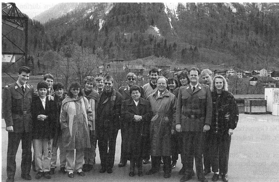
Die mittelrheintalische Delegation im Anschluss an die DV 94 in Braunwald, wo zum dritten Mal in Folge(!) der EMV-Wanderpreis entgegengenommen werden konnte.

Das Pflichtenheft des C Logistik ist vielfältig. Es reicht über die Organisation von Verpflegung und Unterkunft bei Vereinsanlässen, Protokollführung und Führung der Rangliste Sektionsmeisterschaft bis hin zur Berichterstattung in unserem Verbandsorgan. Es ist also erkennbar, das meine Arbeit vor allem am Schreibtisch (EDV) erledigt wird. Jedoch müssen des öfteren auch Unterkünfte "rekognosziert" werden, damit ich mir vor