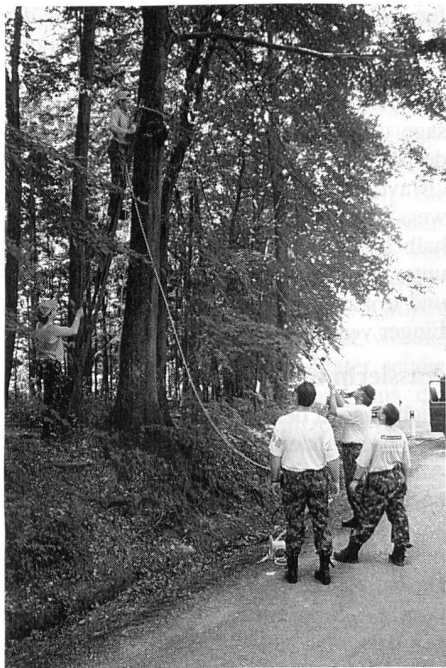
Ein Teil des Bautrupps ist mit dem F20-Hochbau beschäftigt

tungen. Da aber am gleichen Abend das WM-Endspiel stattfand, wurden die Teilnehmer frühzeitig entlassen. Die Demontage des F20 erfolgte am folgenden Samstag und nach einer eingehenden Materialkontrolle konnte wir die Sachen wieder abgeben.