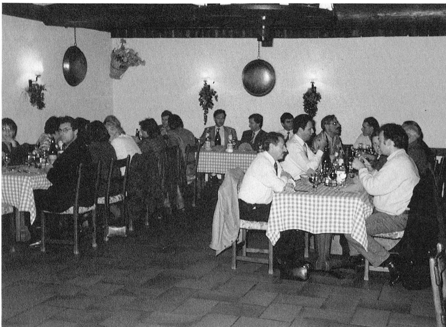
riunione delle "famiglie"

- proprio così, ci siamo trovati sul "ring". Come tutti sanno era prevista la cena di chiusura, come d'uso da tanti anni. - anche costume che prima della cena si faccia una