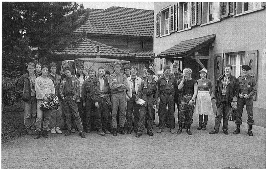
"Ende Feuer" für die Teilnehmer der BCII Funkerkurse Heerbrugg

Am 25. März fand die alljährliche Abschlussübung der Funkerkurse Chur, Buchs und Heerbrugg statt. Es war das letzte Mal, dass Schüler aus den BC-Kursen daran teilnahmen. Wie ja bereits bekannt, werden ab kommenden Herbst nur noch A-Kurse durchgeführt. Dies hat unter anderem auch zur Folge, dass der