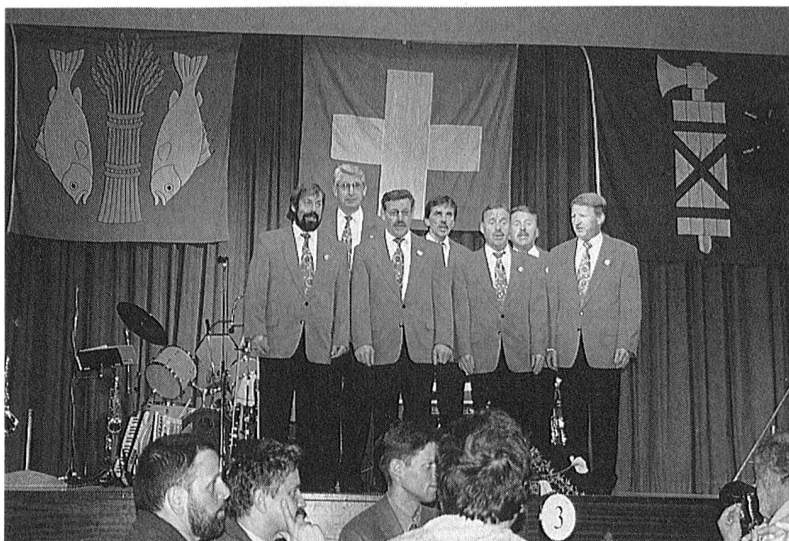
Les chanteurs "Melsner Allround"

A 09.00 heures les invités et délégués se rassemblait au pavillon de musique au port. L'orchestre de la ville de Rorschach à présenté un concert superbe. Accompagné de la musique, une