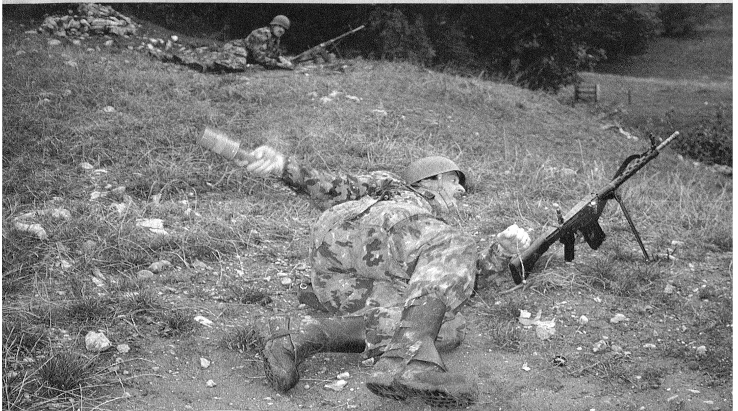
2. Medientag des Ausbildungschef der Schweizer Armee

Organo ufficiale dell'Associazione Svizzera delle Troupe di Transmissione e dell'Associazione Svizzera degli Ufficiali e Sottufficiali Telegrafo da Campo