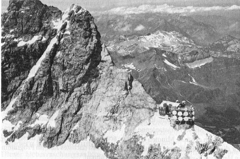
Richtstrahlstation PTT, Jungfrauoch, 3'750 m.ü.M.

Erfahrung in der Bereitstellung besass, war ein solches innert wenigen Minuten startklar. Ein aufkommendes Gewitter setzten dem lustigen Treiben auf dem See aber wieder ein rasches Ende und männiglich verzog sich wieder nach Innen in die Pontonierstube. Um 18 Uhr war auch für die Letzten