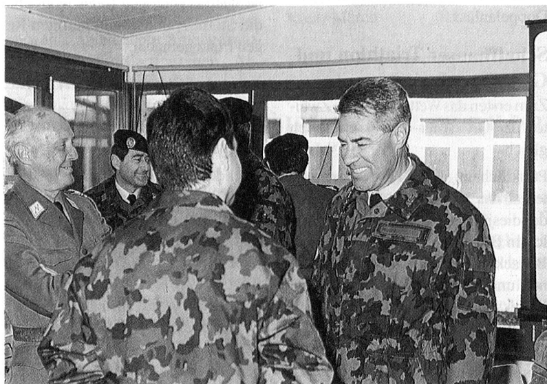
L'armata sorridente e tranquilla