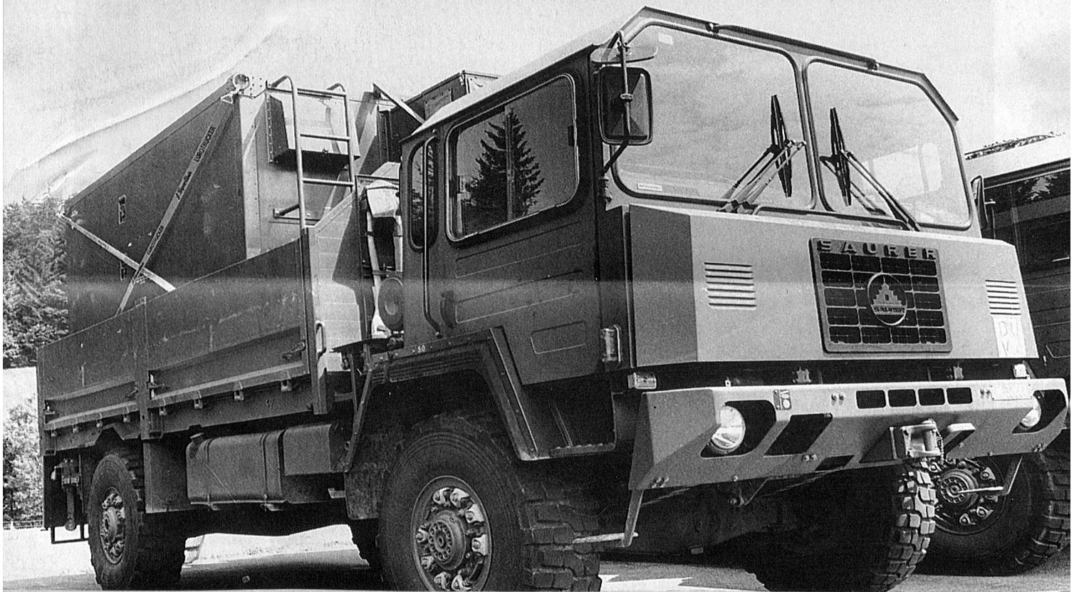
Elo Aufklärung für Armeekorps

Organo ufficiale dell'Associazione Svizzera delle Troupe di Transmissione e dell'Associazione Svizzera degli Ufficiali e Sottufficiali Telegrafo da Campo