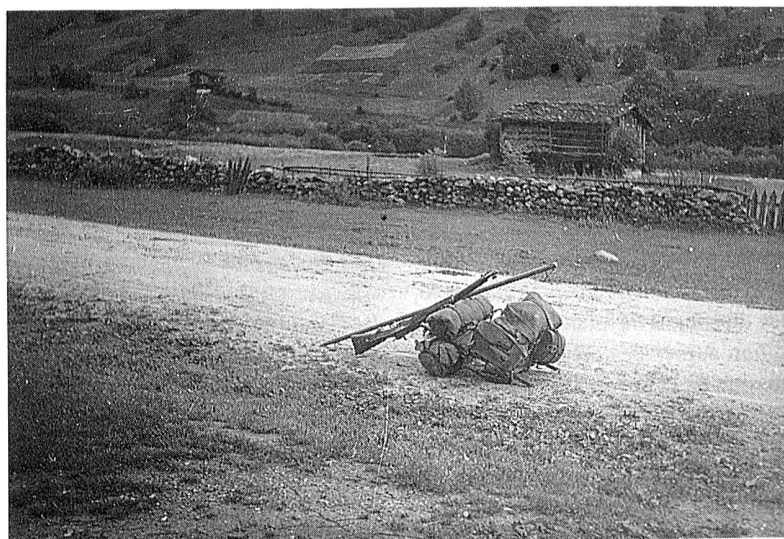
la cadola carica e bastone di montagna