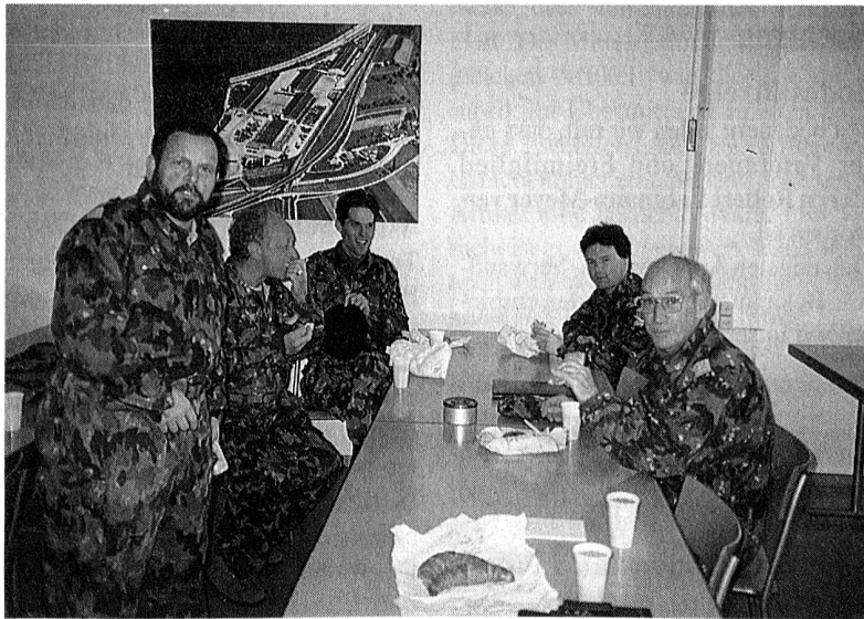
Kombinierte Einstz-Verpflegungs "Uebung" des (fast) "Altherren-Clubs"

Im Namen und im Auftrag des Sektionsvorstandes zu den kommenden Festtagen alles Gute. Zum Jahreswechsel allen unseren Mitgliedern und Angehörigen einen gehörigen Rutsch und die Hoffnung, dass zumindest einige der, ja immer vorhandenen, Wünsche in Erfüllung gehen werden.