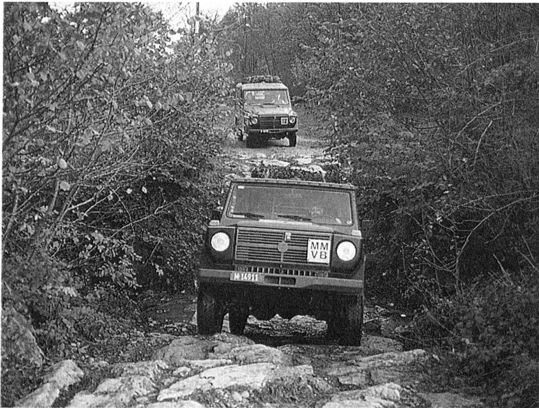
Ein Bach ist kein Hindernis mehr

Schlag zu treffen. Die erste Gelegenheit wird wohl kaum lange auf sich warten lassen.