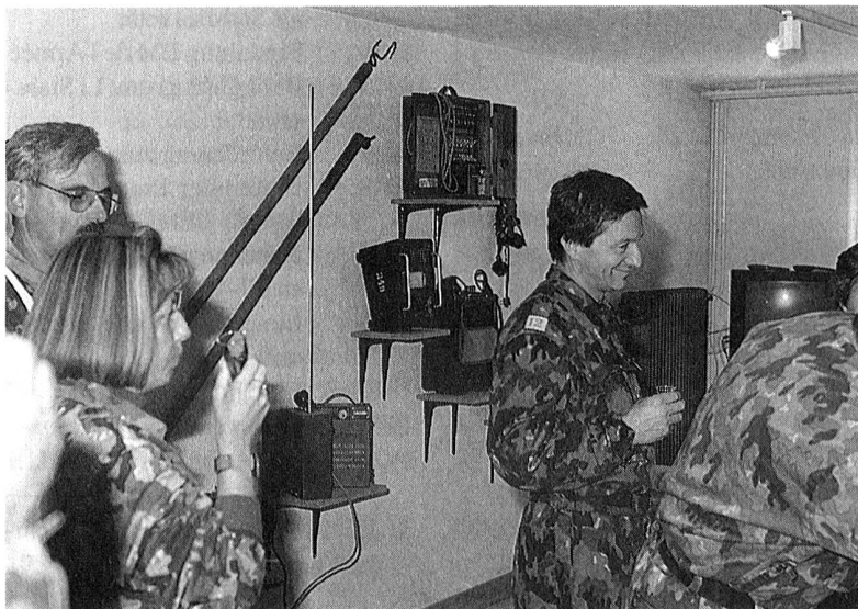
un presidente contento