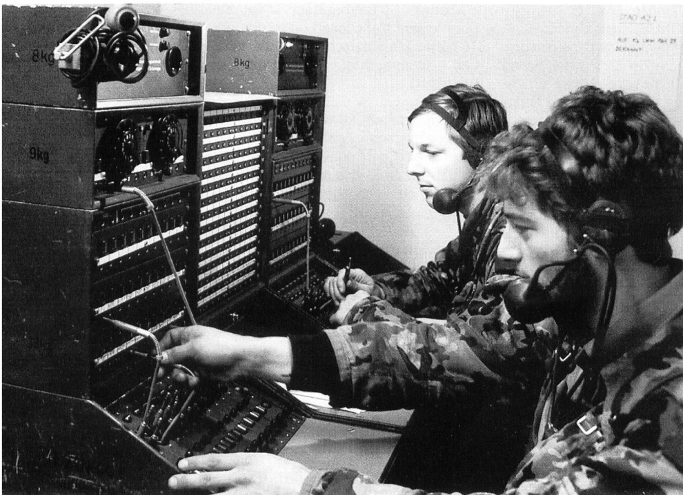
Nostalgische Übermittler-Ansicht ...

Aufgrund der Vorgaben in der WA-UEM und den Ausbildungskonzepten neuer