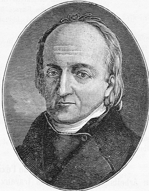
Emanuel von Fellenberg