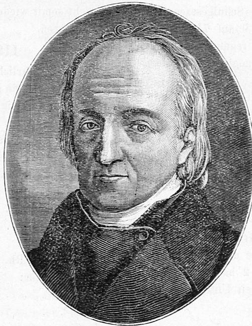
Emanuel von Fellenberg