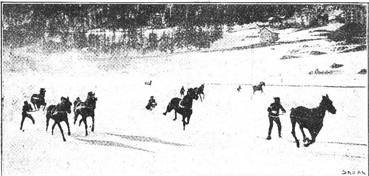
Skikjöring-Wettrennen auf dem See bei St. Moritz.