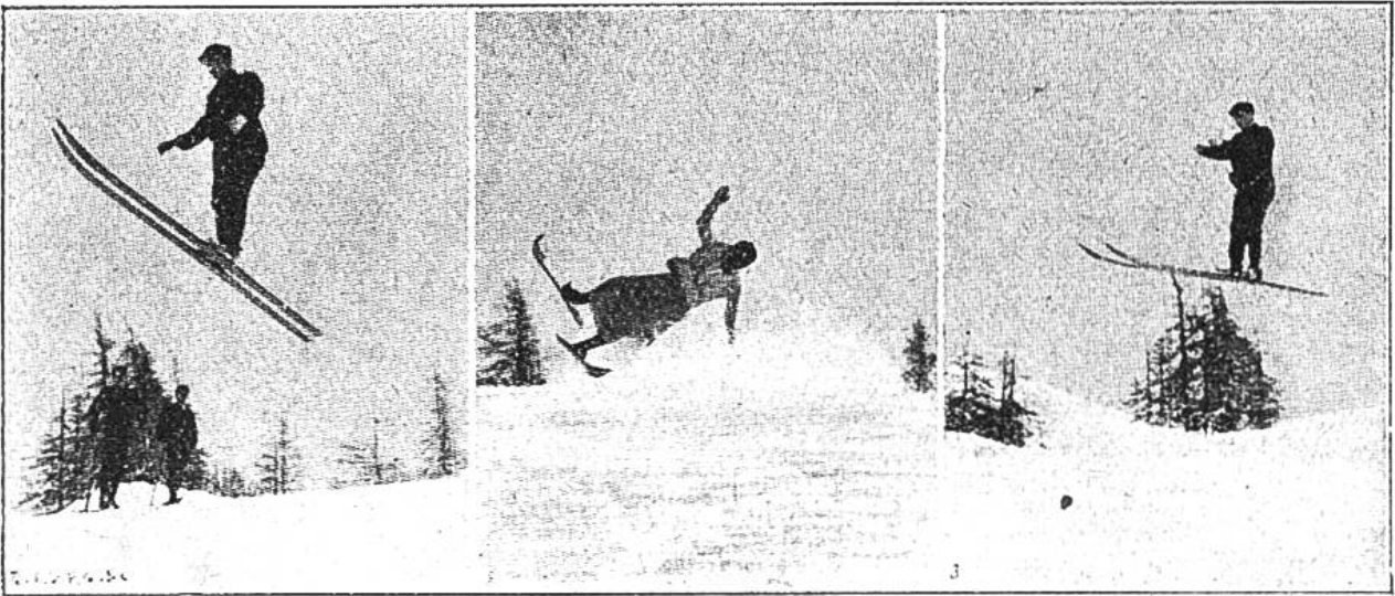
Zwei gute Sprünge und ein Exempel wie man es nicht machen soll.