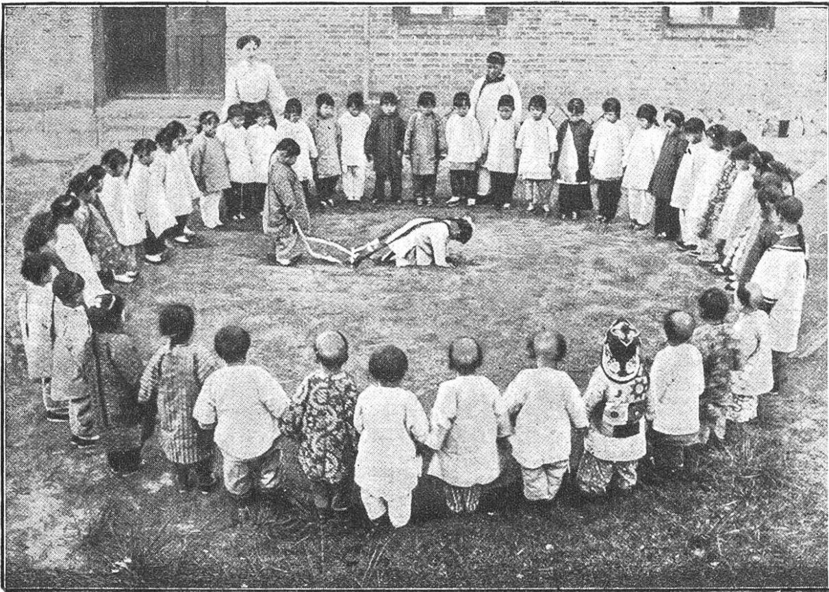
Anschauungsunterricht in einer chinesischen Kinderschule. Darstellung des Pflügens.