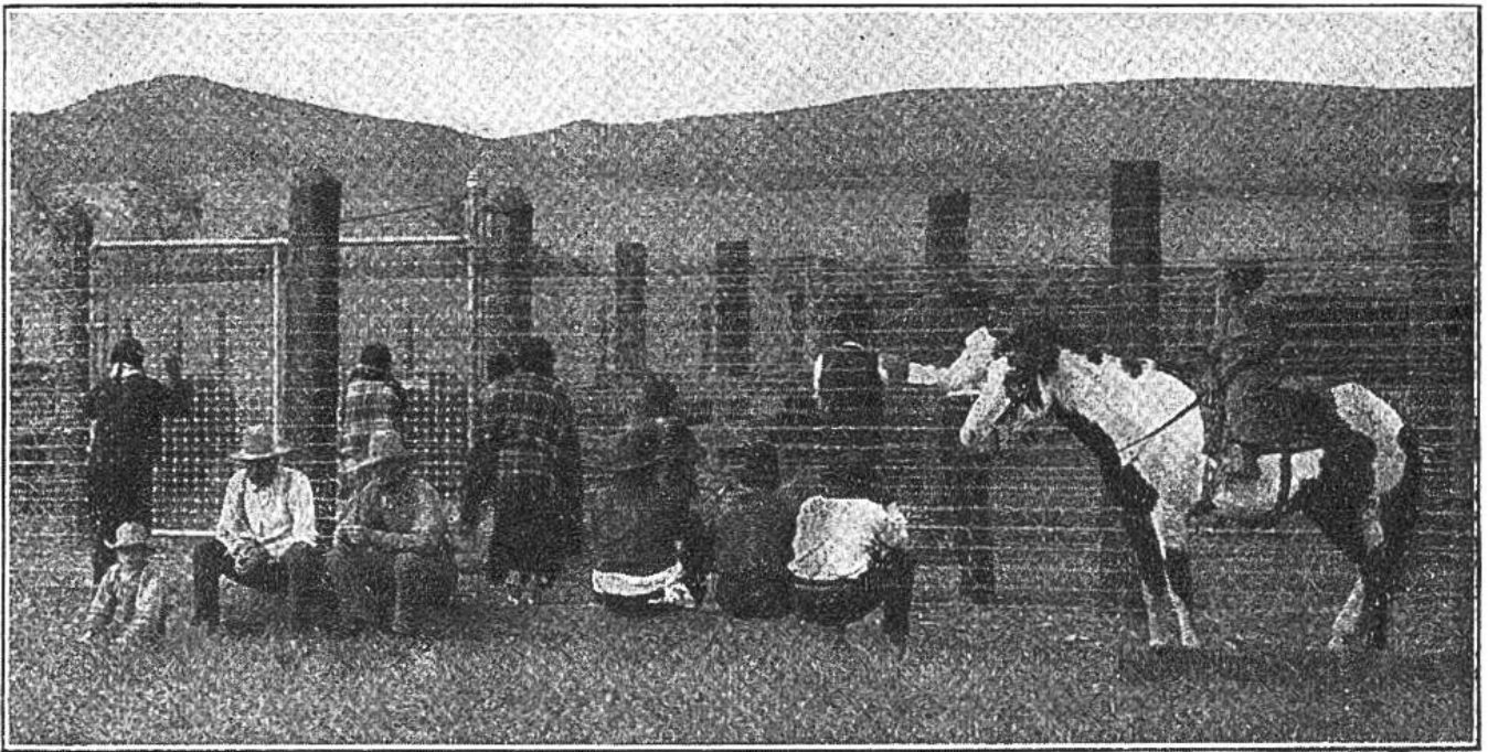
Vor der Umzäunung des Büffelparkes.

nur noch 2047 rassenreine Büffel auf der Erde leben, wovon 325 wild und 1722 in Gefangenschaft. Von den wilden leben 25 in den Vereinigten Staaten, 300 in Kanada, von den gefangenen 1116 in den Vereinigten Staaten, 476 in Kanada und 130 in Europa.