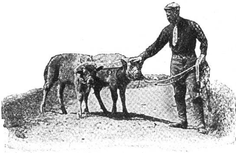
Büffelkälber im Joche.

Flasche tranken, ernährte. Zwei der Tiere gewöhnte er an Zugarbeit. Als sie erst ein Jahr alt waren, wurden sie im Winter zum Treiben des Schnees in den Strassen verwendet. Heute sind diese Büffel, die einzig zahmen die existieren, 3 Jahre alt. Herr Baynes nimmt sie oft mit zu Sportfesten und Landmärkten, um das Publikum für