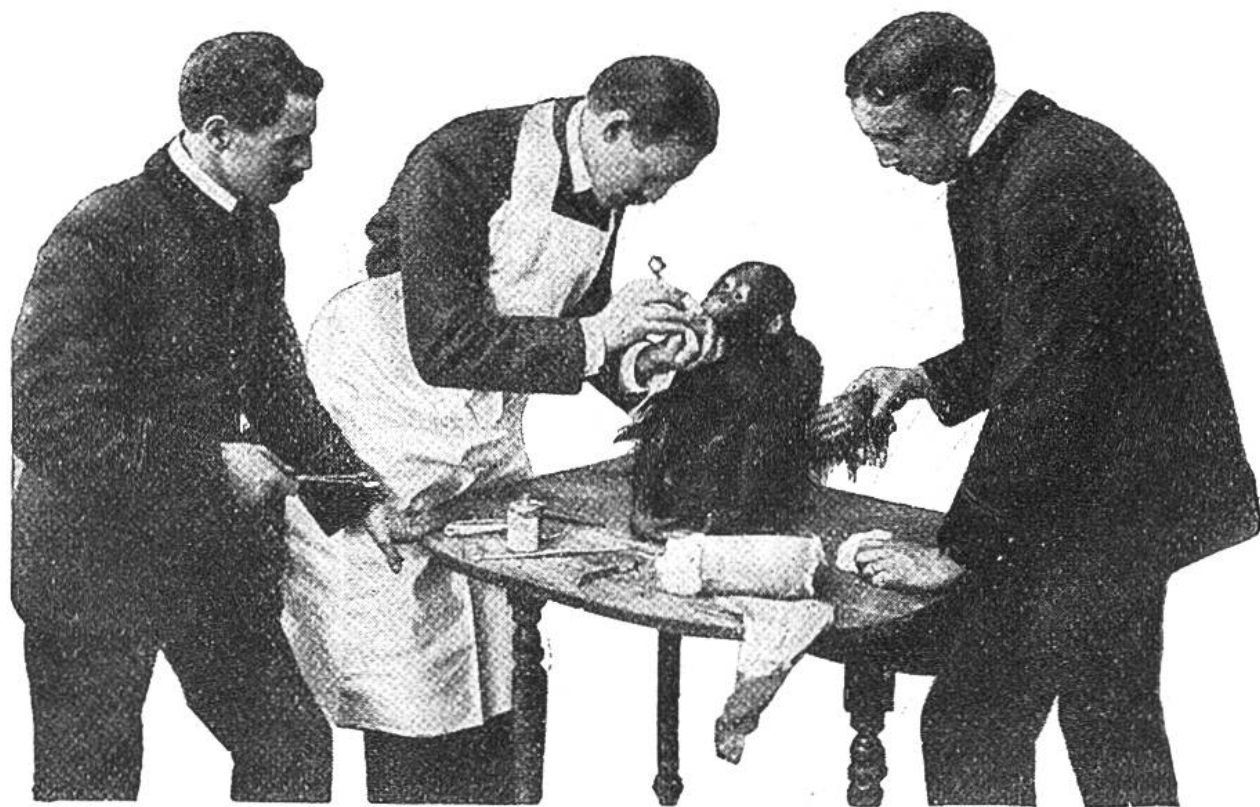
Zahnoperation im zoologischen Garten in Neuyork.