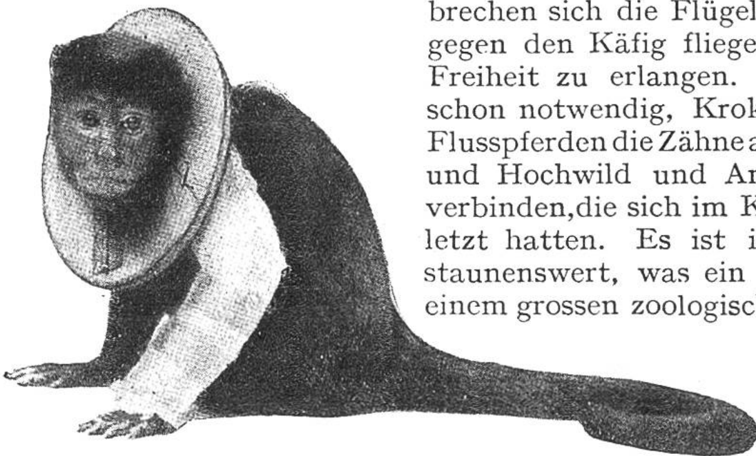
Affe mit gebrochenem Arm. Der Kragen um den Hals verhindert ihn, mit den Zähnen den Verband aufzureissen.

Der Elefant ist häufig Patient des Arztes. Grosse Vögel brechen sich die Flügel, indem sie gegen den Käfig fliegen, um ihre Freiheit zu erlangen. Es wurde schon notwendig, Krokodilen und Flusspferden die Zähne auszuziehen und Hochwild und Antilopen zu verbinden, die sich im Kampfe verletzt hatten. Es ist in der Tat staunenswert, was ein Tierarzt in einem grossen zoologischen Garten alles an einem Tage zu tun hat.