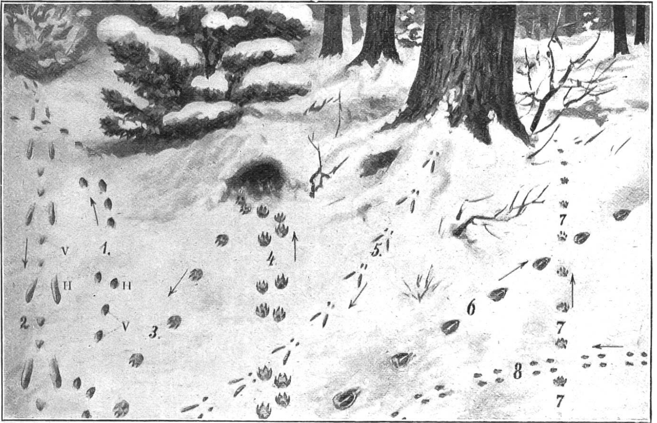
Spuren im Schnee. 1. Fluchtspur des Hasen. — 2. «Das Hoppeln» des Hasen. — 3. Die Fährte des Fuchses. — 4. Fluchtspur des Fuchses. — 5. Eichhörnchen. — 6. Reh. — 7. Wildkatze. — 8. Hermelin. — V = Vorderfüsse. — H = Hinterfüsse.