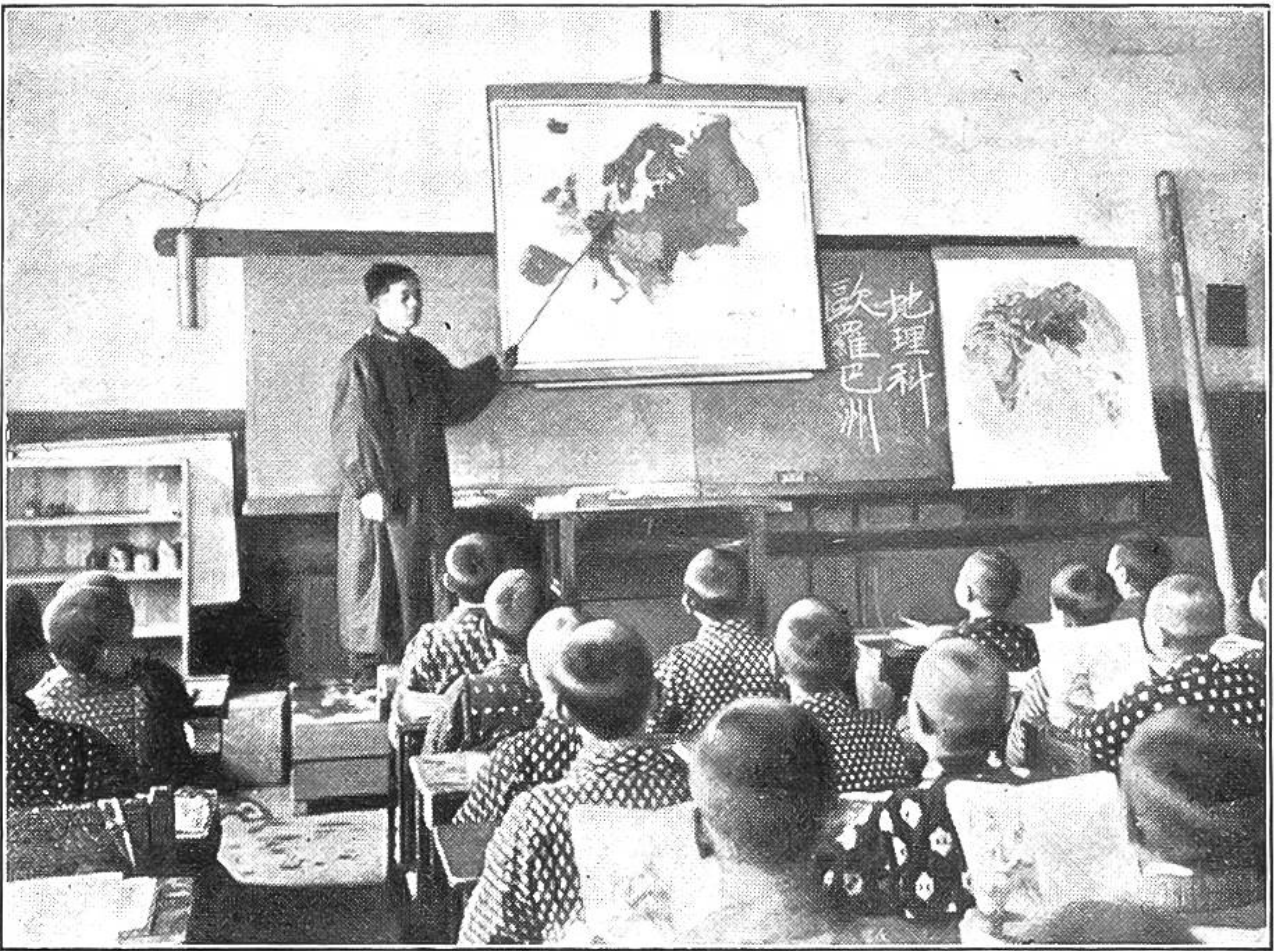
Japanische Volksschule. Schweizergographie!