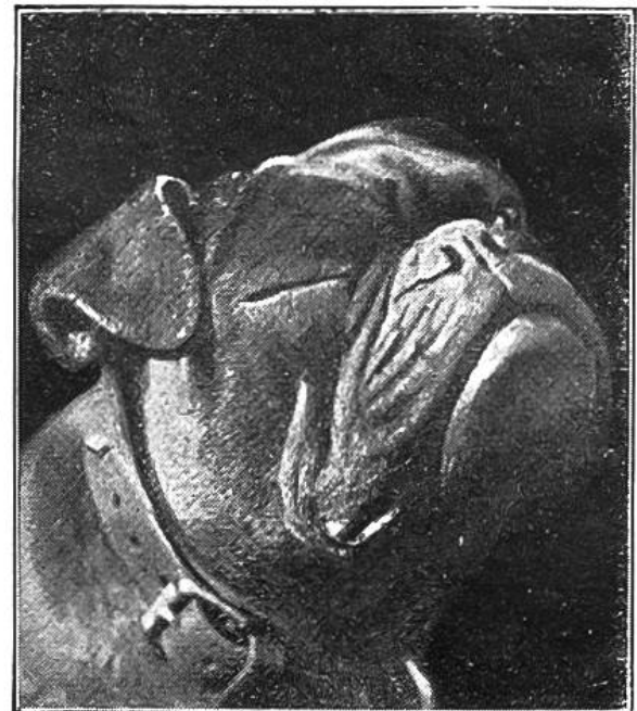
Wird schon wieder Klavier gespielt?