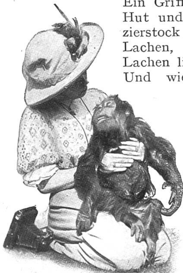
Ein dankbarer Pflegling.