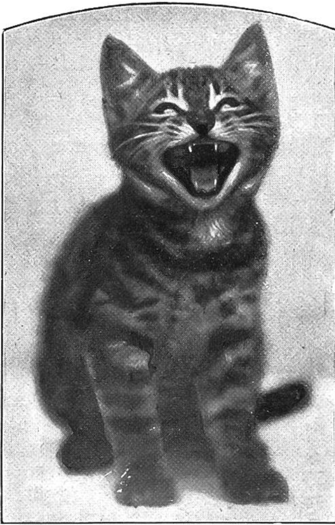
Pussy ist zufrieden.

alles an Dankbarkeit, Zuneigung zu der besorgten Pflegerin! »