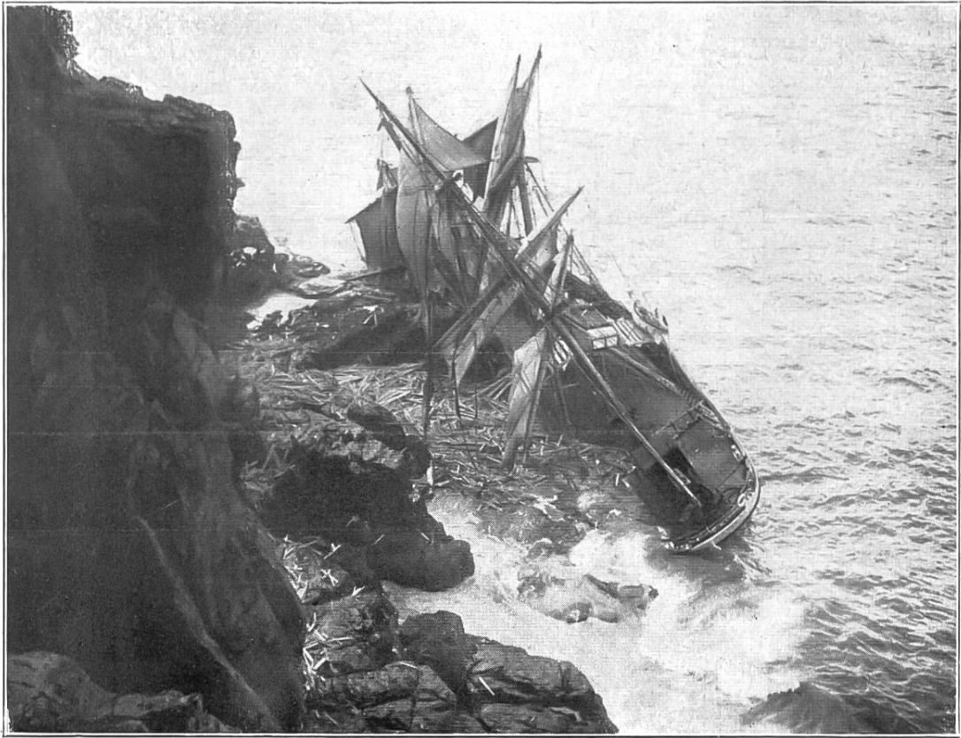
Ein an der englischen Küste gestrandetes norwegisches Segelschiff. Phot. Aufnahme.