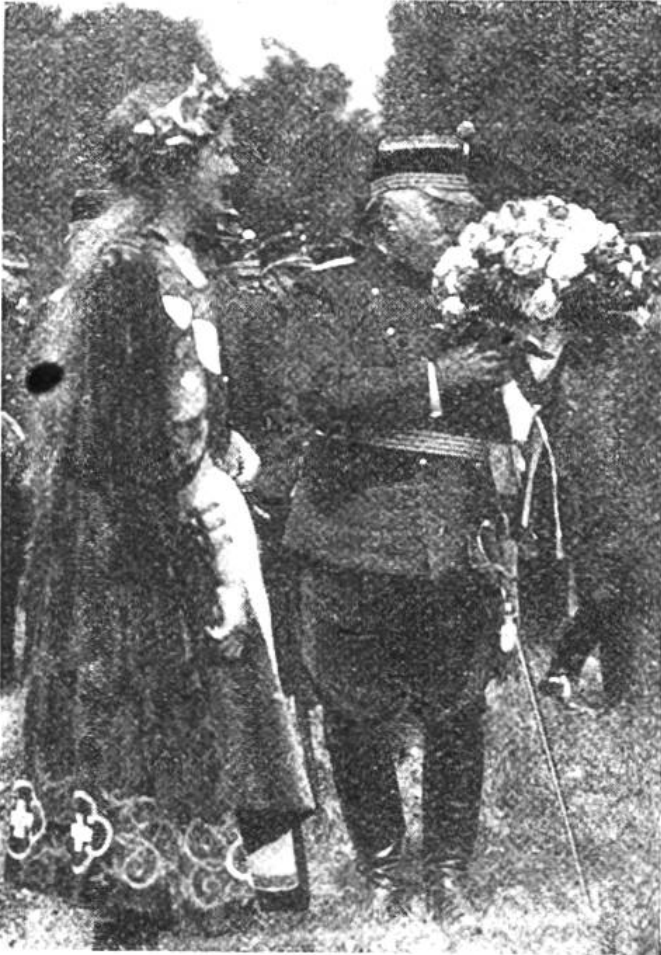
General Wille an der Murtenschlachtfeier.