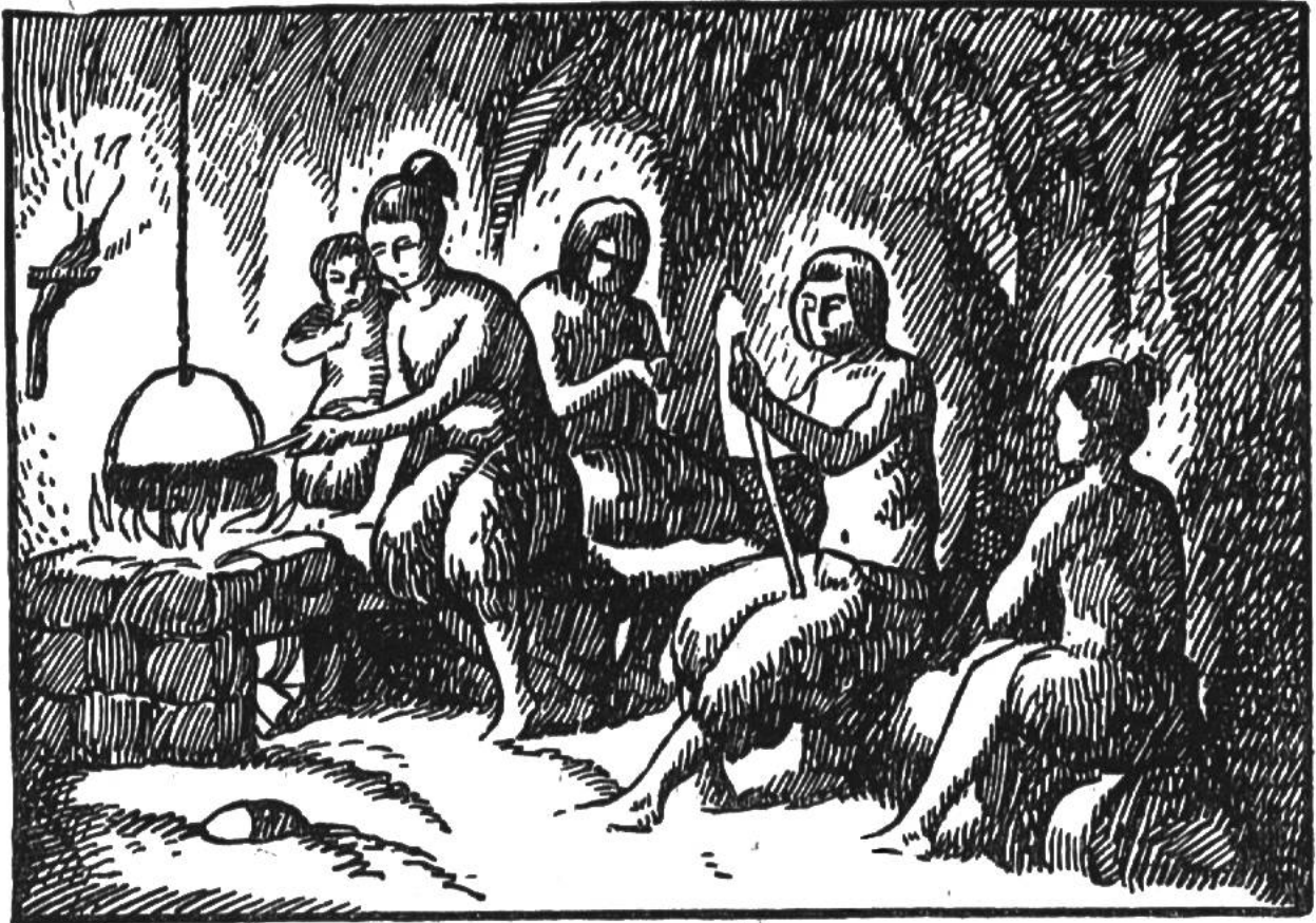
Höhlenbewohner am Herdfeuer.

Gast unbesorgt bleiben; eine eigene Höhle wurde ihm eingeräumt und die Würdigsten jedes Stammes bewachten das Feuer Tag und Nacht. Wehe dem, der die Flamme erlöschen liess! Dieses Verbrechen wurde mit dem Tode bestraft.