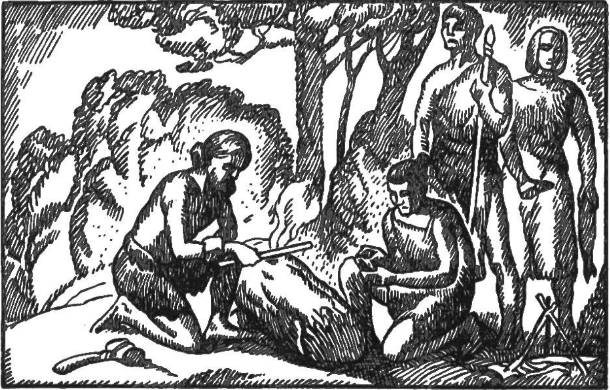
Die Menschen erlernen Feuer zu erzeugen.

Aber noch bestand die grosse Gefahr, dass das Feuer in der Regen- oder Winterszeit erlösche. Da machte ein Mensch die Entdeckung, dass sich die Flamme beliebig herbeschwören liess. Wurden zwei trockene Holzstäbe, ein harter und ein weicher, rasch und geschickt aneinander gerieben, so erschien plötzlich das himmlische Wesen; die Holzstäubchen entzündeten sich und die Funken konnten in dürrem Gras oder Laub aufgefangen und entfacht werden. Ehrerbietig wurde dem eben von Gott kommenden Boten Fett zum Empfange gereicht, damit er befriedigt und guter Laune sei, und bald loderte das Feuer helleuchtend auf. An die emporsteigenden Flammen und den zum Himmel strebenden Rauch richtete der Mensch seine Gebete, mit der Bitte, sie den Göttern zu überbringen.