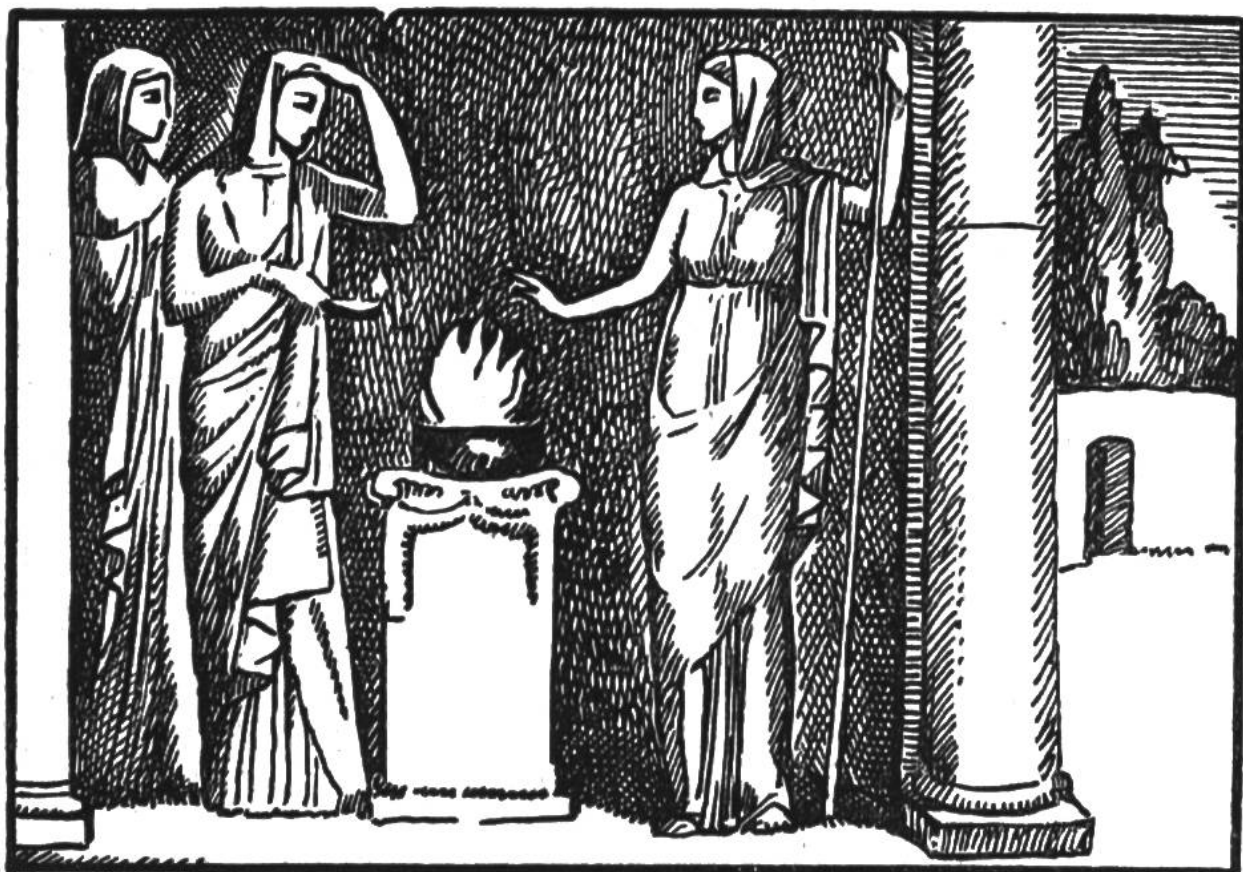
Vestalinnen bewachen das heilige Feuer.

sprühte Funken, besonders wenn es im Dunkel der Höhle mit einem eisenhaltigen Stein bearbeitet wurde. Der Mensch nannte es deshalb Feuerstein. Er lernte auch, diese Funken auffangen und beleben. Nun lag es in seiner Macht, Flammen zu entfachen, und damit begann er, Herr über das Feuer zu werden.