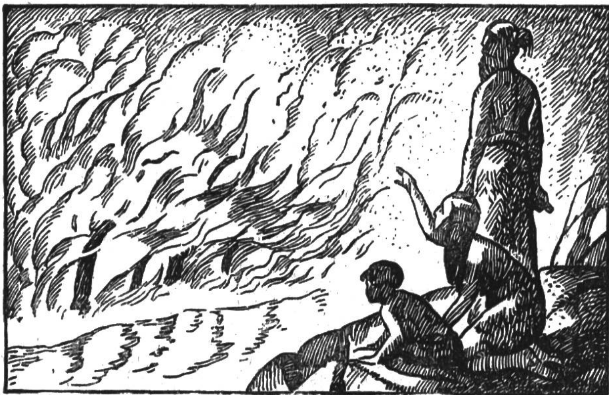
Urmenschen betrachten einen Waldbrand.