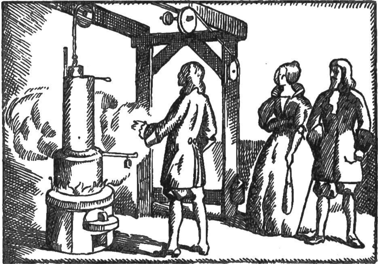
1690 Papin baut eine Dampfmaschine und verwendet das Feuer zur Kräftezeugung.

Ausgangspunkt war die Eroberung des Feuers. Das Feuer schuf uns Töpferei, Glas, Metalle, Porzellan und ermöglichte die meisten heutigen Gewerbe. Das Feuer machte den Menschen vom Klima unabhängig, setzte die Völker instand, sich über die Erde zu verbreiten und sogar den Schrecken einer Eiszeit Trotz zu bieten. Wie das Feuer als Wärmespender die menschlichen Lebensbedingungen verändert hatte, veränderte es sie von neuem durch seine direkte Verwendung bei technischen Arbeiten.