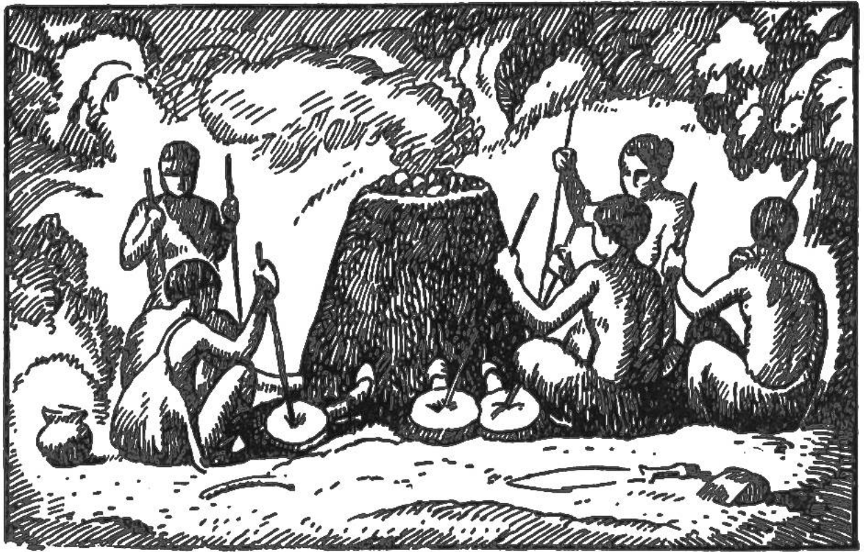
Erzgewinnung in primitivem, mit Blasebälgen angefachtem Ofen.

— Die Töpferei war erfunden. — Noch heute bewundern wir die schönen Formen der ältesten Geschirre.