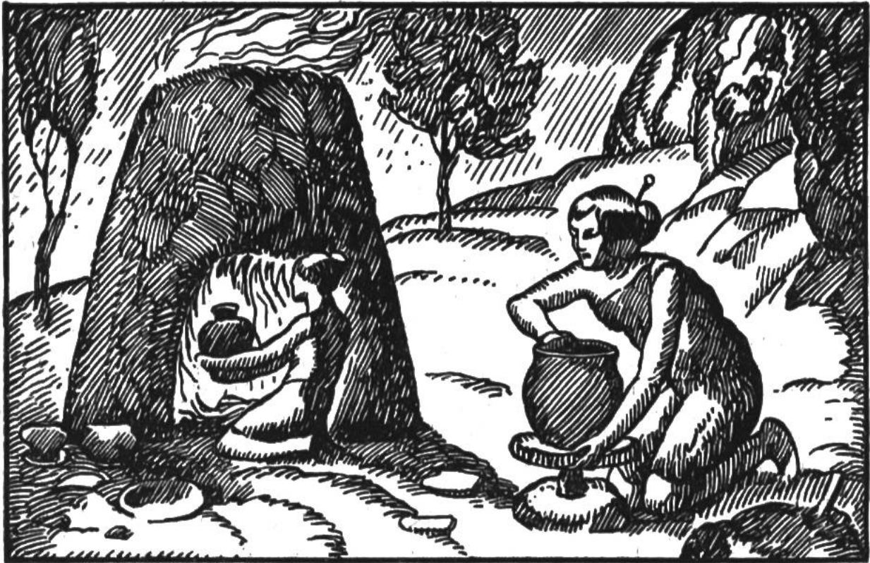
Unsere Urahnen beim Tonformen und -brennen.

Steiermark Feuerwächter ewige reine Flammen und waren dafür von allen Steuern befreit. Ihre Brandstätten dienten dazu, für Oster- und Johannisfeuer und den Herd der Neuvermählten reine Glut abzugeben. Im Frühjahr zündeten die Bauern auf den Äckern Reisighaufen mit Glut von der heiligen Flamme an. Der Rauch, der über die Felder strich, sollte die Saat vor Schaden bewahren. Der Feuerwart erhob die Hand zum Schwur, dass er das Jahr hindurch die Flamme immer getreulich gepflegt habe und dass es noch die gleiche Flamme sei, die einst im germanischen Walde « die weisse Frau » seinem Urahn geschenkt habe.