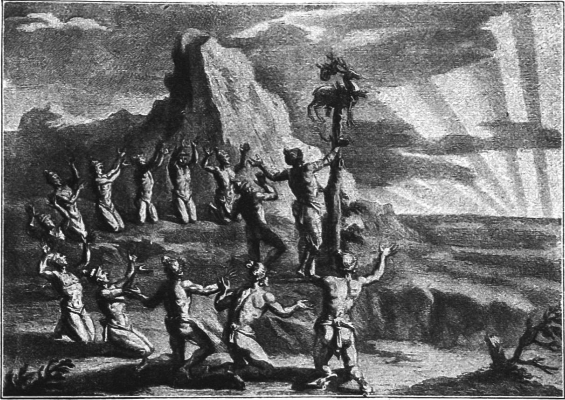
ANBETUNG DER AUFGEHENDEN SONNE DURCH UREINWOHNER VON AMERIKA. Stich aus dem Jahre 1723 nach dem Bericht eines französischen Forschungsreisenden.