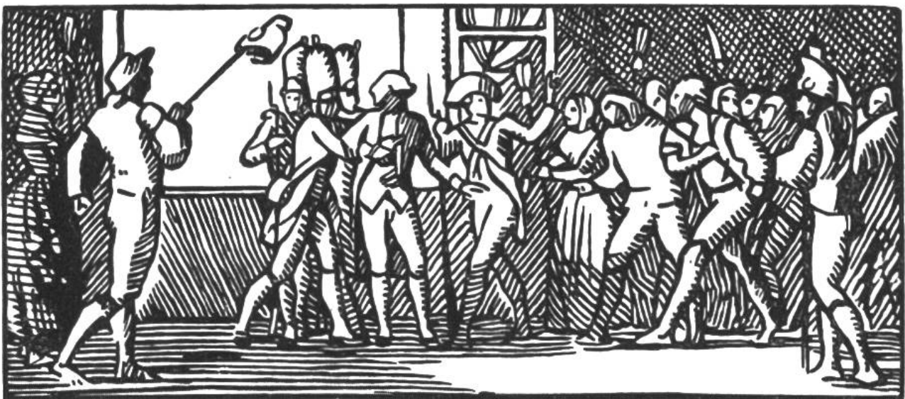
Französisches Volk setzt Ludwig XVI. die Freiheitsmütze auf.