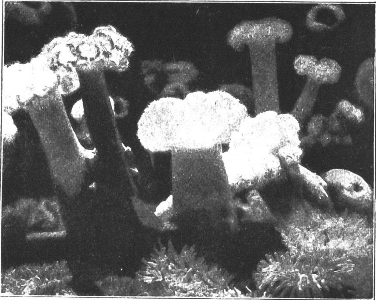
Seenelken und Seerosen aus dem grossen Aktinien-Aquarium der Biologischen Anstalt auf Helgoland.

bescheidenen Wesen der wundersamen Tiere verbirgt sich die äusserste Gefrässigkeit. Meermuscheln, Austern, Stücke Fleisch, was in den Bereich ihrer Fühler oder Fangarme kommt, wird hinuntergewürgt. Während der Verdauung bleiben sie ruhig geschlossen, um sich alsdann wieder strahlend zu entfalten. War die geschlossene Aktinie schmutzig, unscheinbar gefärbt, so entwickelt sie in gesättigtem Zustand eine wunderbare Weichheit der Farben und Farbenschattierungen. Ein weiches Wogen, leichtes Biegen und Schwellen geht durch den ganzen Körper, dessen Wandungen durchscheinend werden, als wären sie von mattem Glas oder feinstem Porzellan.