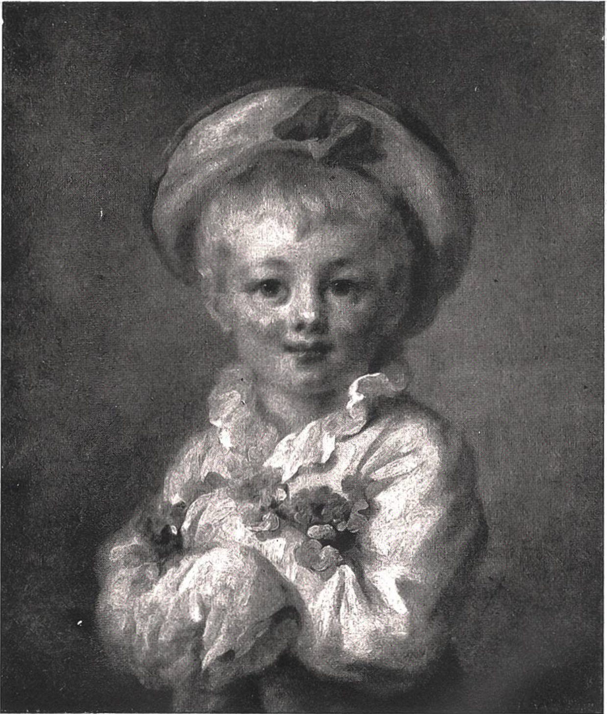
Der blonde Junge von Jean Honoré Fragonard, Paris, 1732—1806. Koll. Wallace