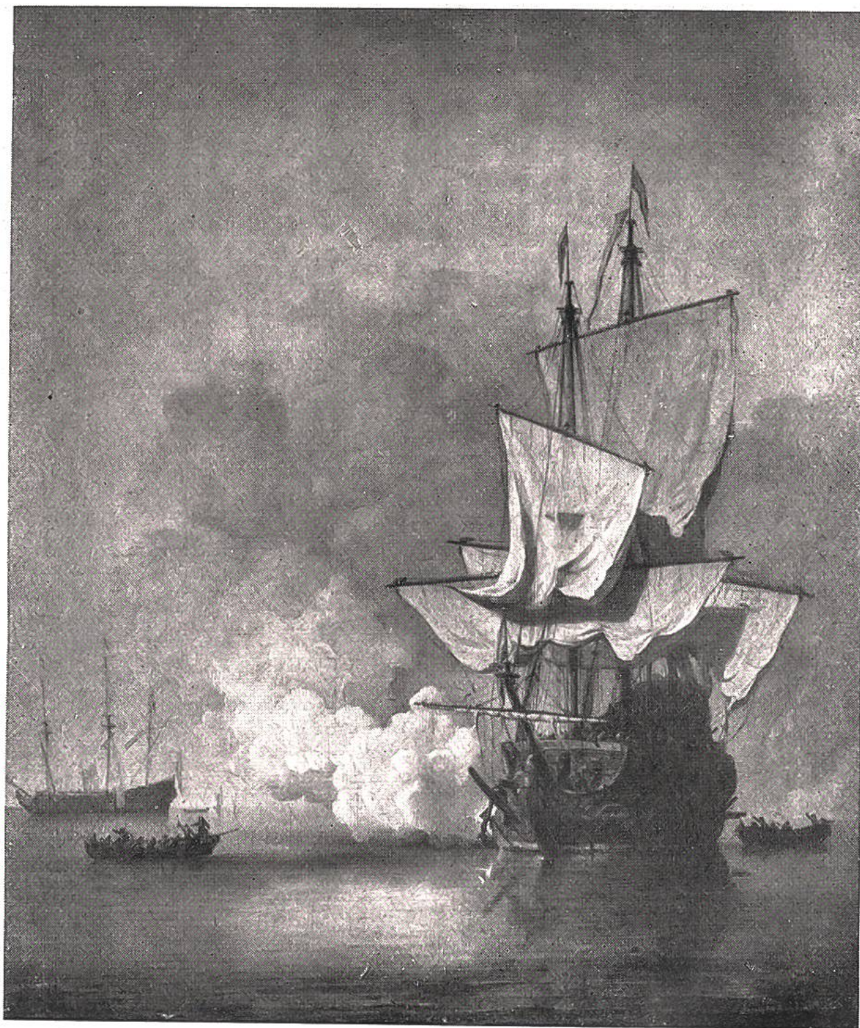
Der Kanonenschuß von Wilh. van de Delbe, Amsterdam, 1633—1707. Amsterdam