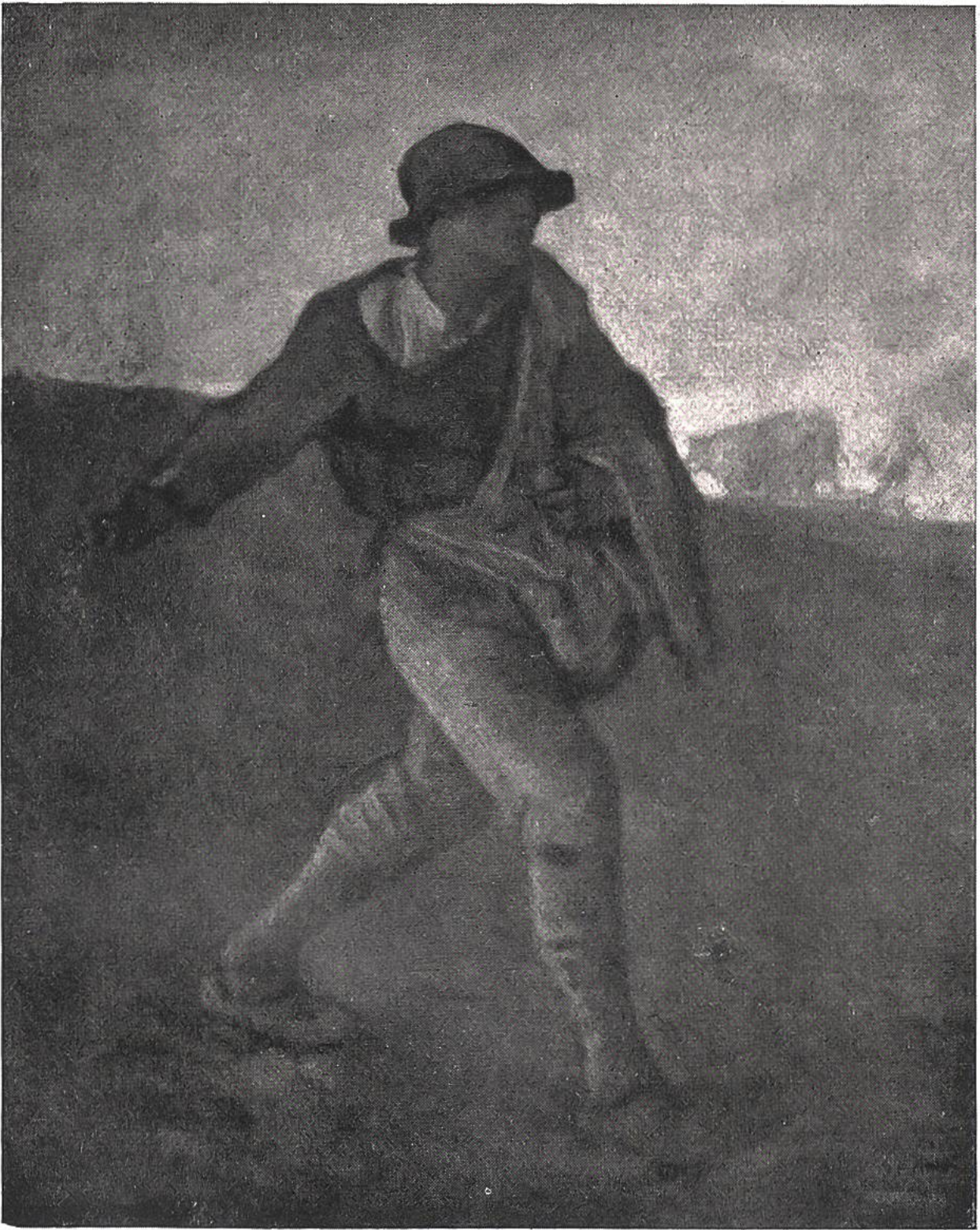
Der Sämann von J. F. Millet, Cherbourg (Frankr.), 1814—1875