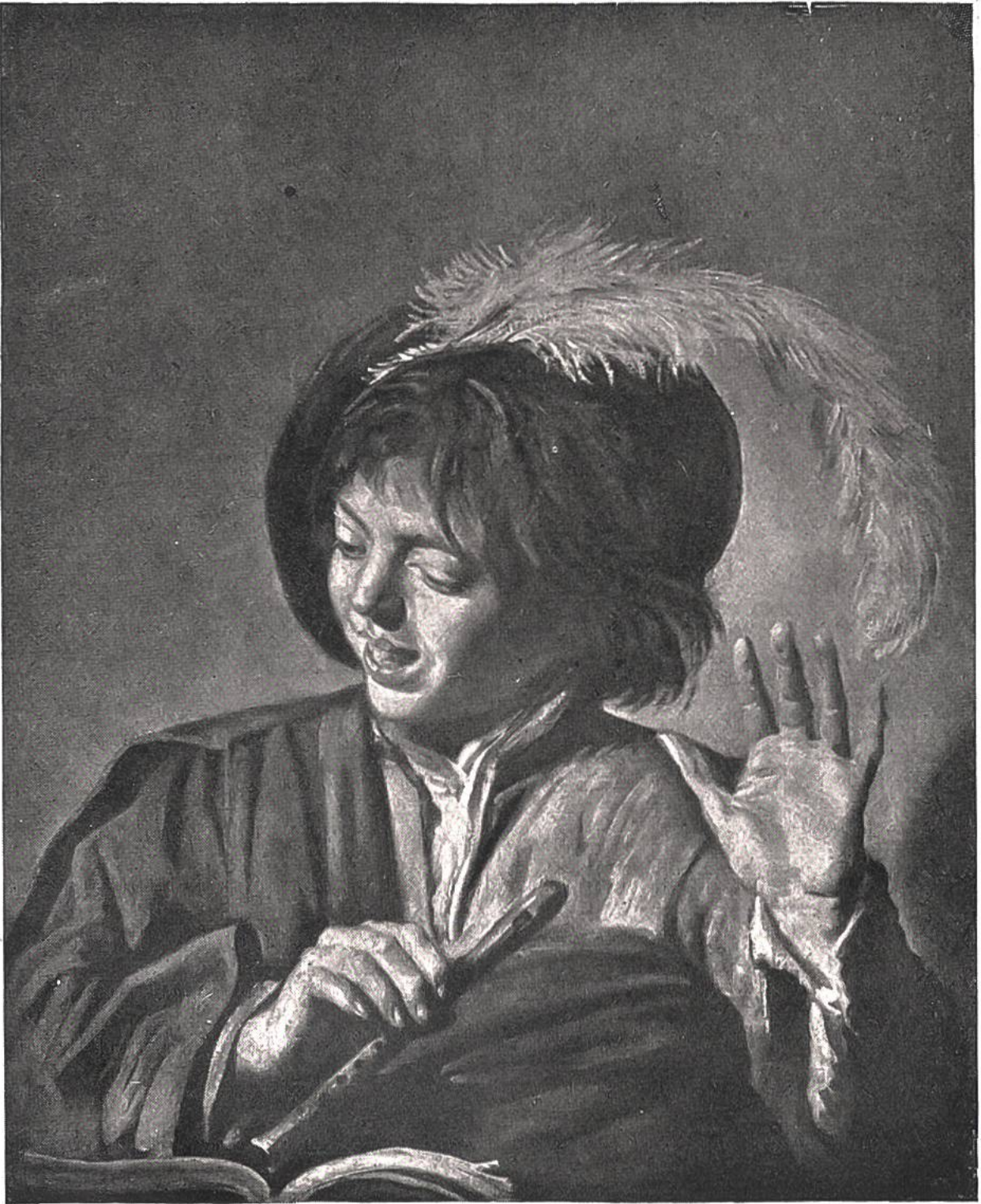
Singender Knabe von Franz Hals, Antwerpen, 1580–1666. Berlin