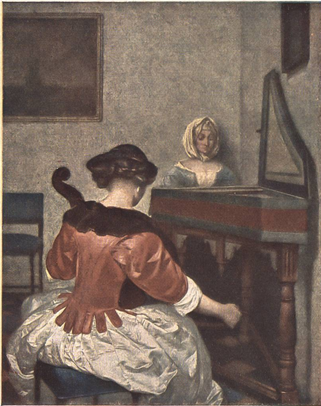
DAS KONZERT Gerard Terborch 1617 — 1681. — Kaiser Friedrich - Museum, Berlin