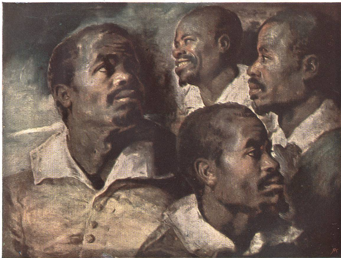
NEGERKOPFSTUDIEN Peter Paul Rubens 1577 Antwerpen 1640