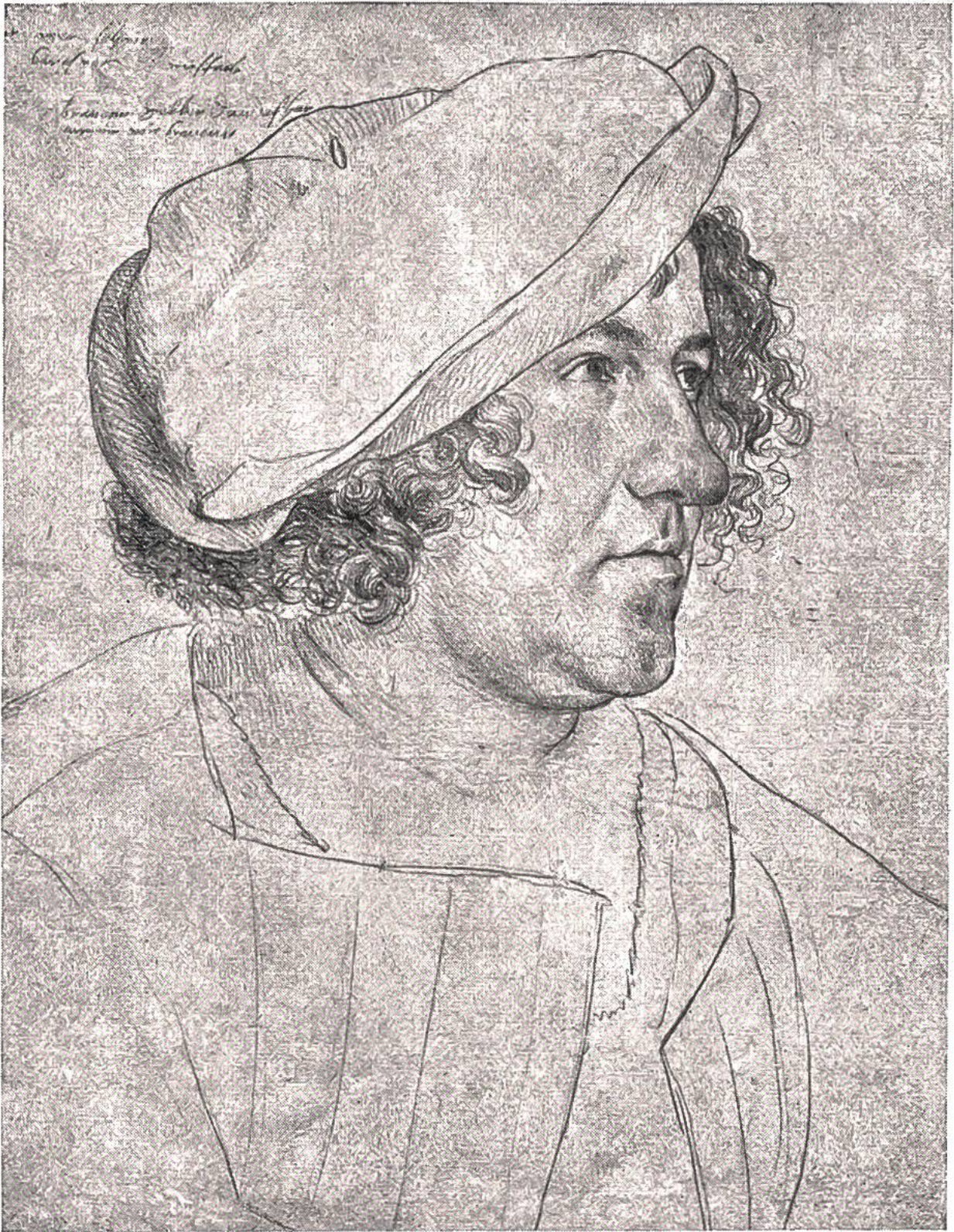
Basler Bürgermeister Jakob Meyer von Hans Holbein d. Jüngern, 1497—1543