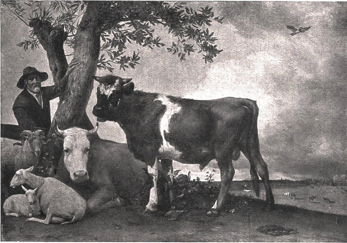
Junger Stier von Paul Potter, Am- sterdam, 1625—1654