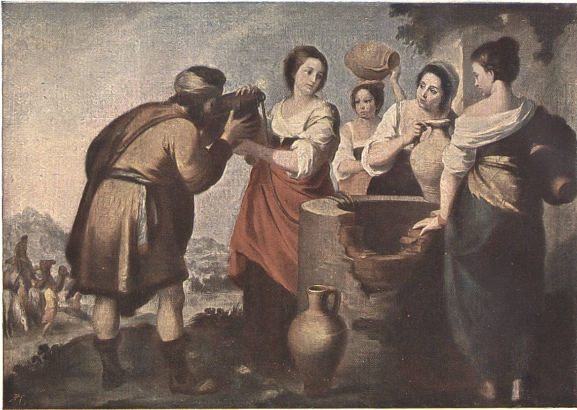
REBEKKA UND ELIESER Bart. Est. Murillo 1618 Sevilla 1682