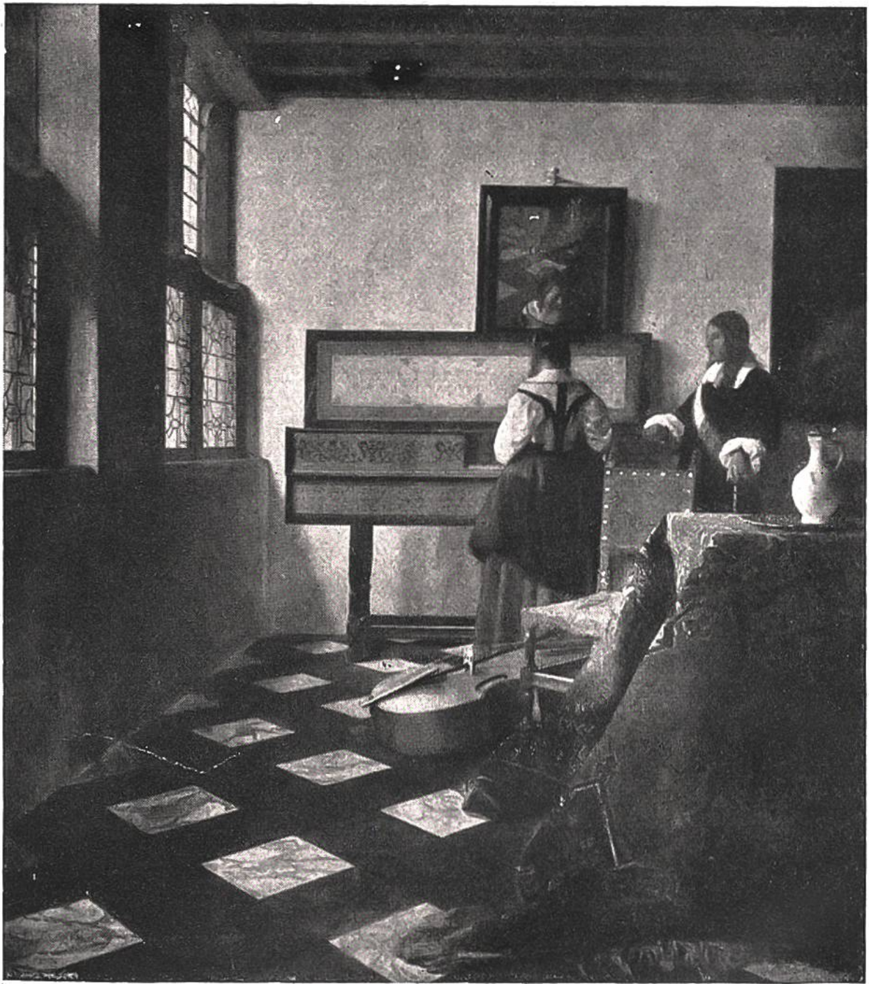
Musiklehrer und Schülerin von Jan van der Meer (Vermeer), Delft, 1632–1675. Windsor