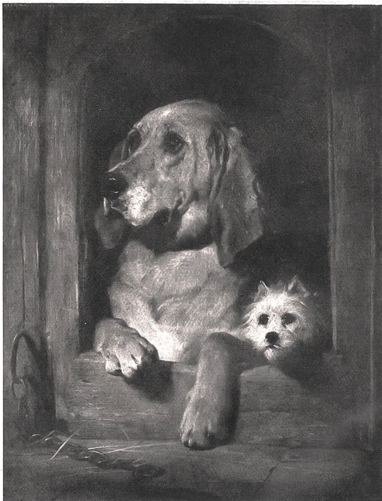
„Würde und Frechheit“, v. Edwin Landseer, London, 1802—1873. Nationalgalerie London