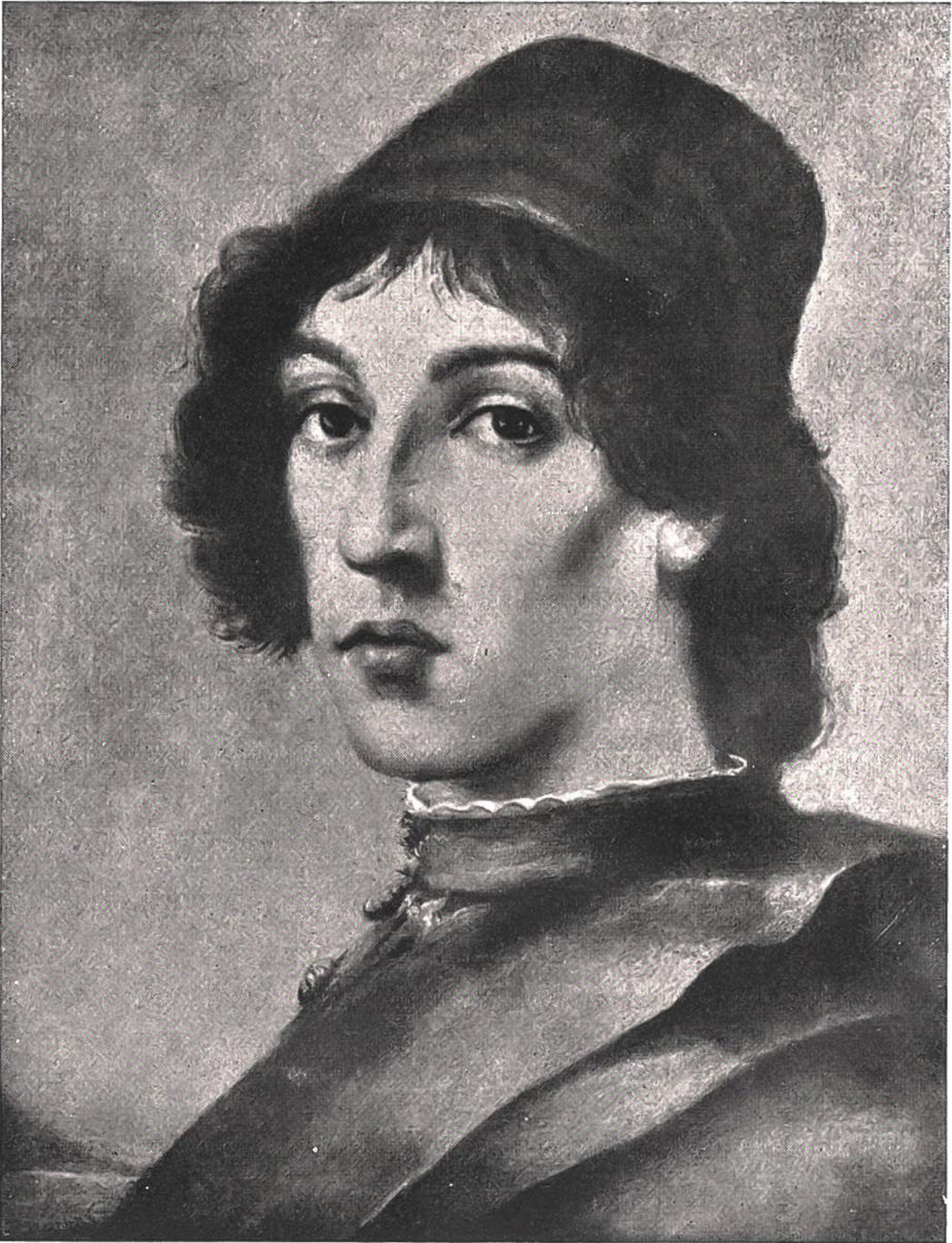
Selbstbildnis von Tommaso Masaccio, Rom, 1401—1428