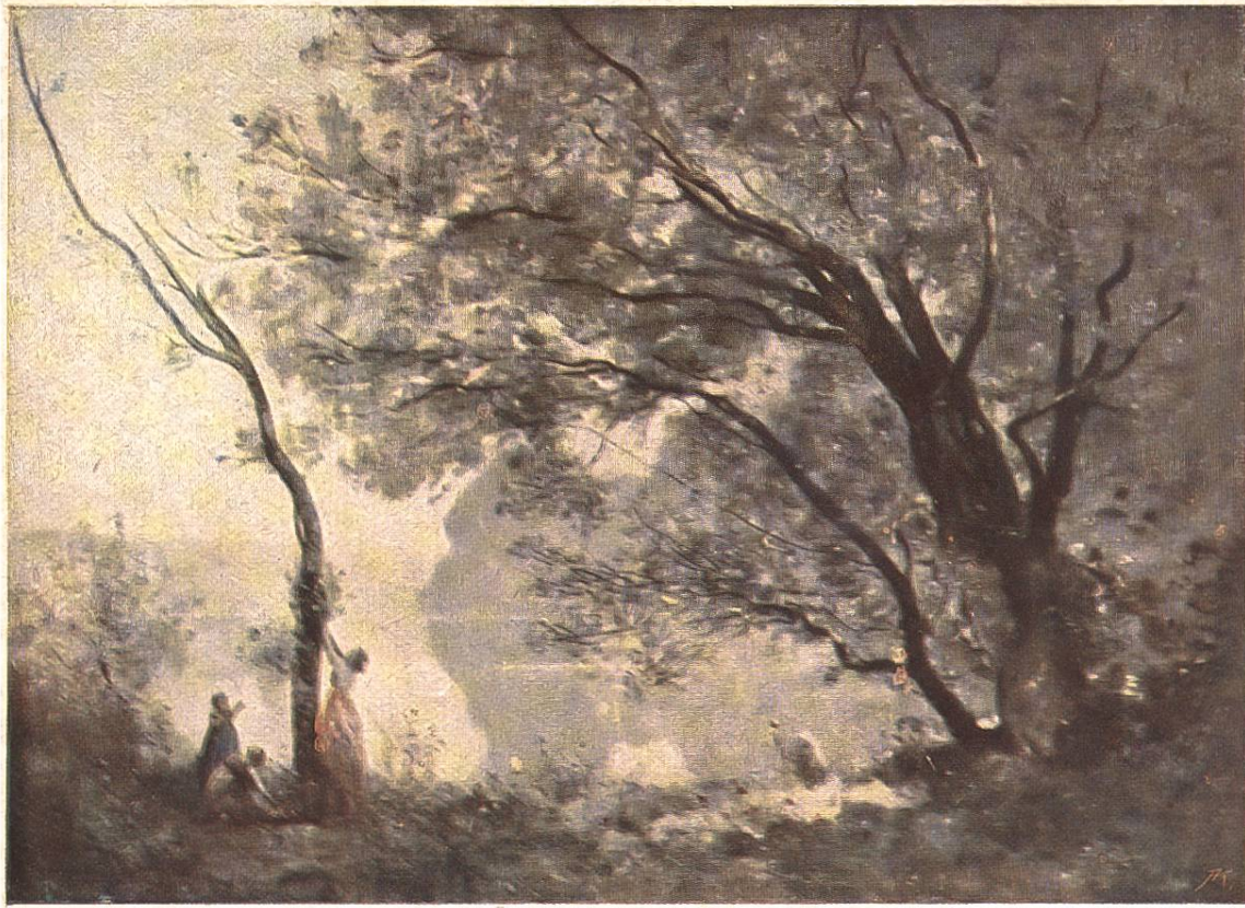
MORGEN AM TEICH Camille Corot 1796 Paris 1875