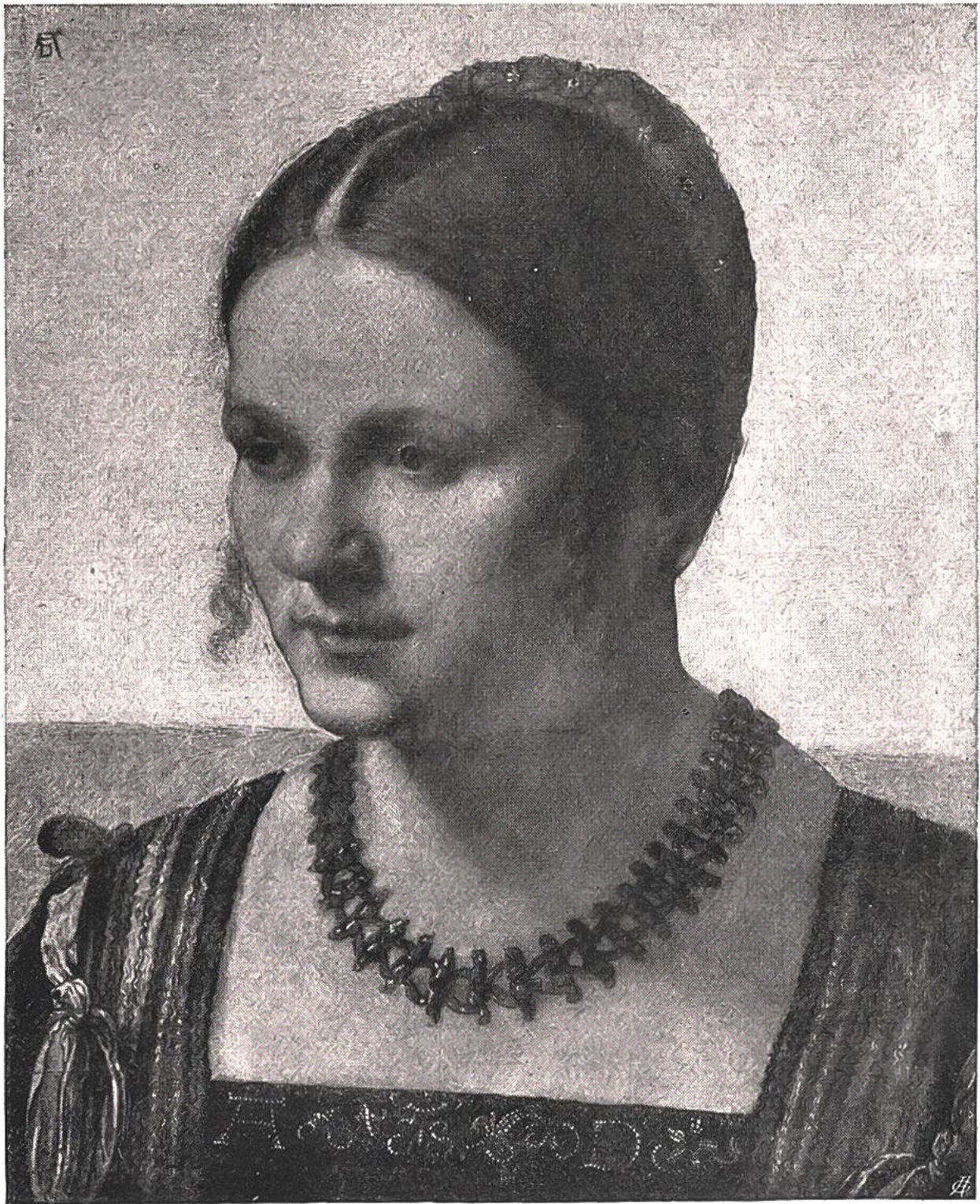
Junge Frau von Albrecht Dürer, 1471—1528. In Berlin