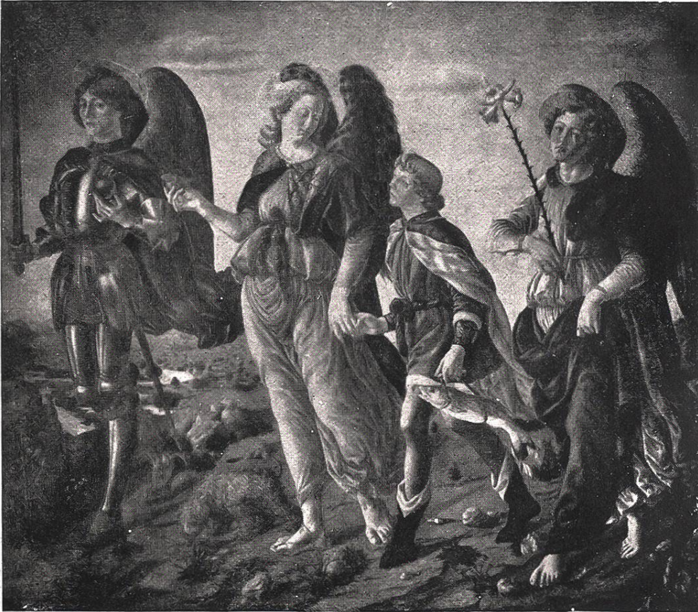
Tobias und die 3 Erzengel von Sandro Botticelli, 1443–1510, Florenz. Akademie Florenz