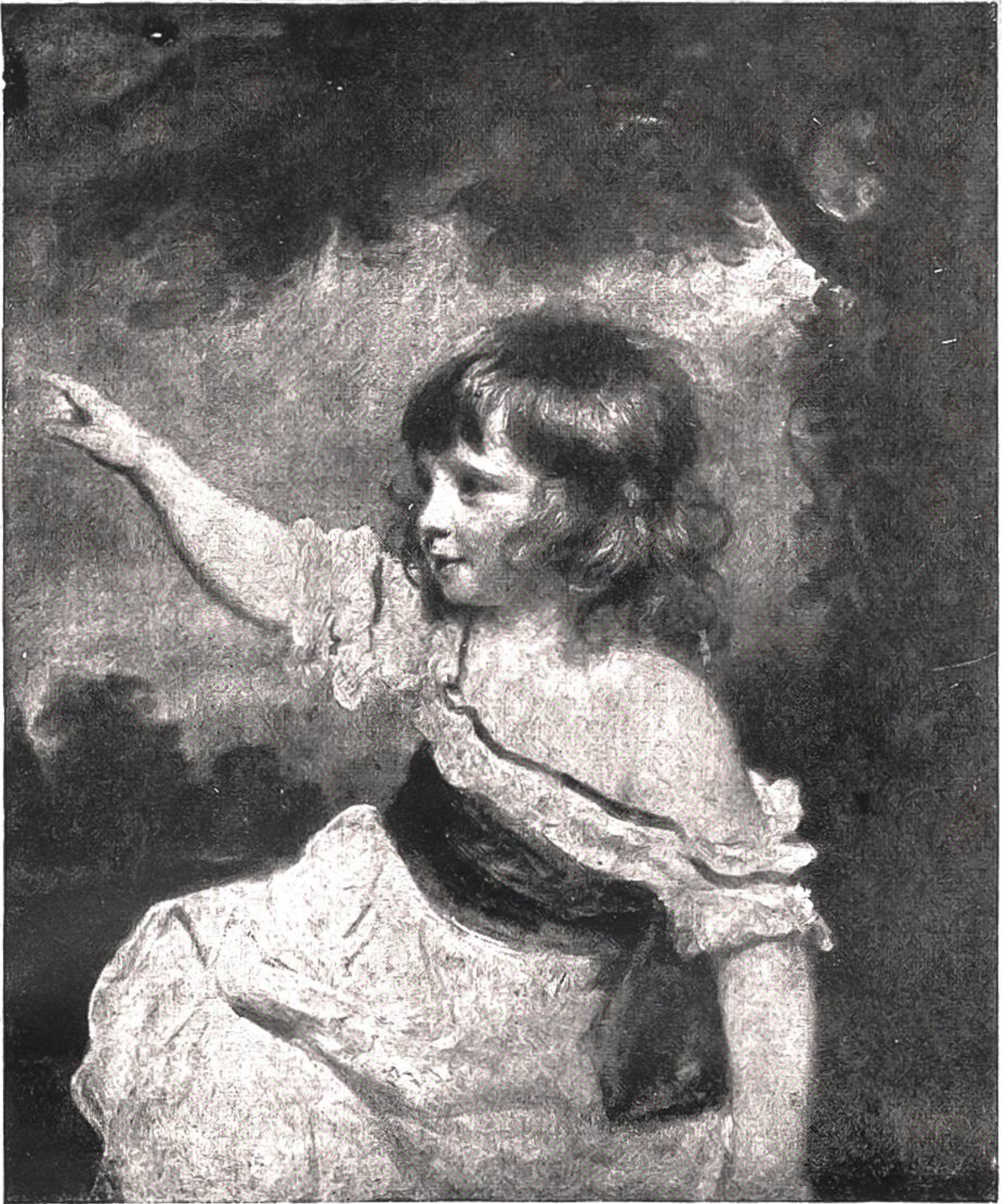
Master Hare von Joshua Reynolds, Plymouth, 1723—1792. Louvre Paris