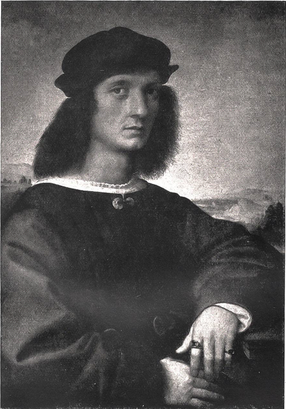
Angelo Doni von Raffael, Urbino= Rom, 1483–1520. Galleria Pitti, Florenz