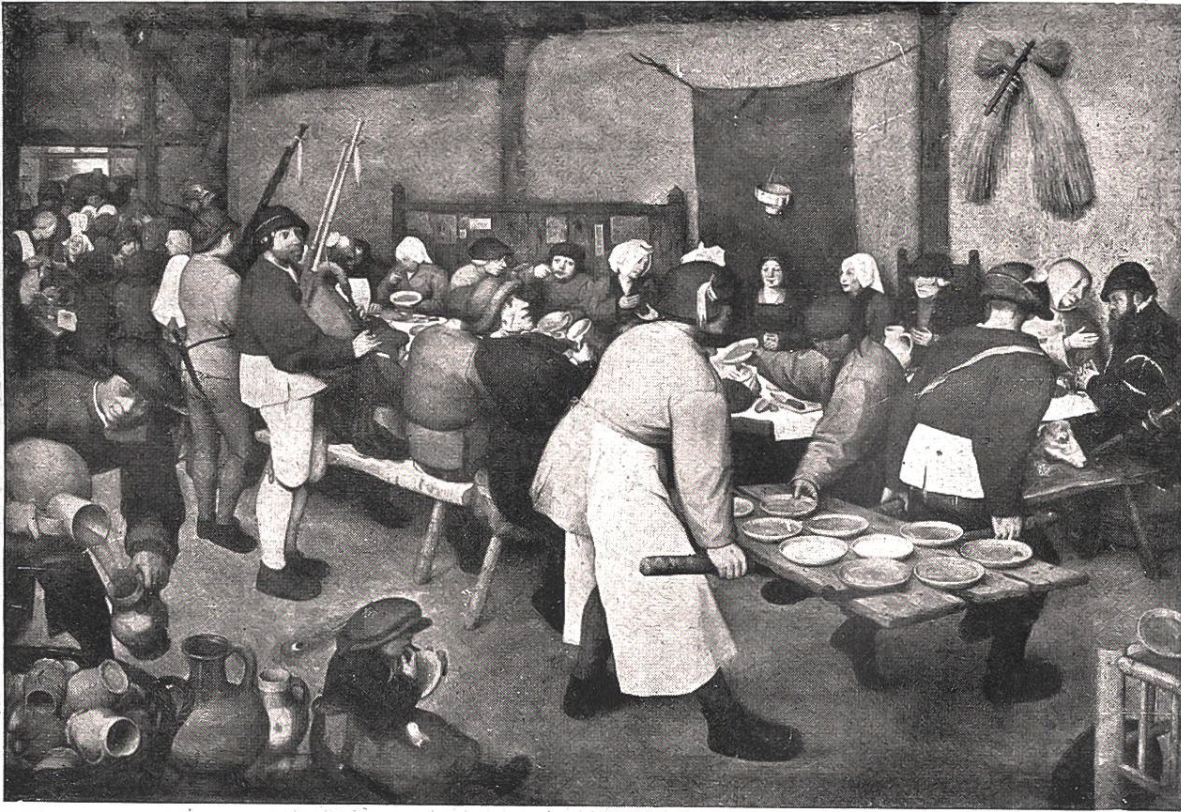
Bauernhochzeit von Peter Breughel d. Ältern, 1525—1569. Antwerpen