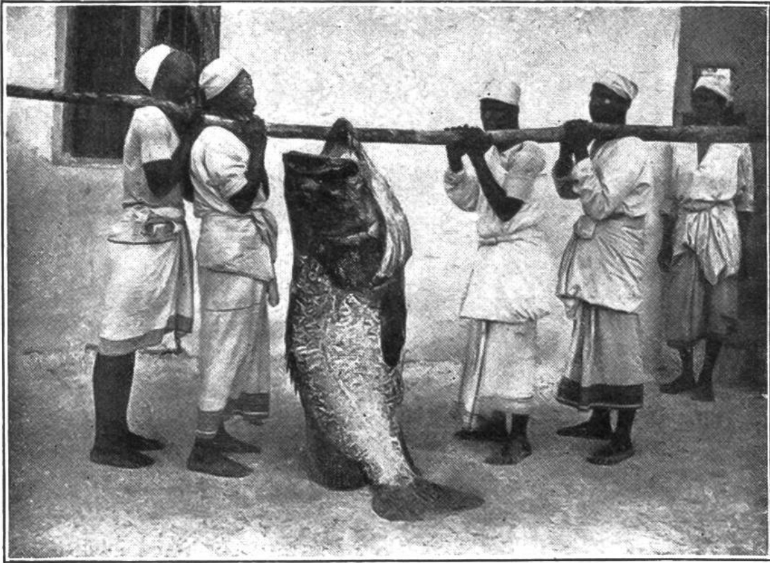
Gewichtige Beute. Ein „Arapaima“, gewaltiger Süßwasserfisch, der im Rio Negro und Amazonasstrom viel gefangen wird.