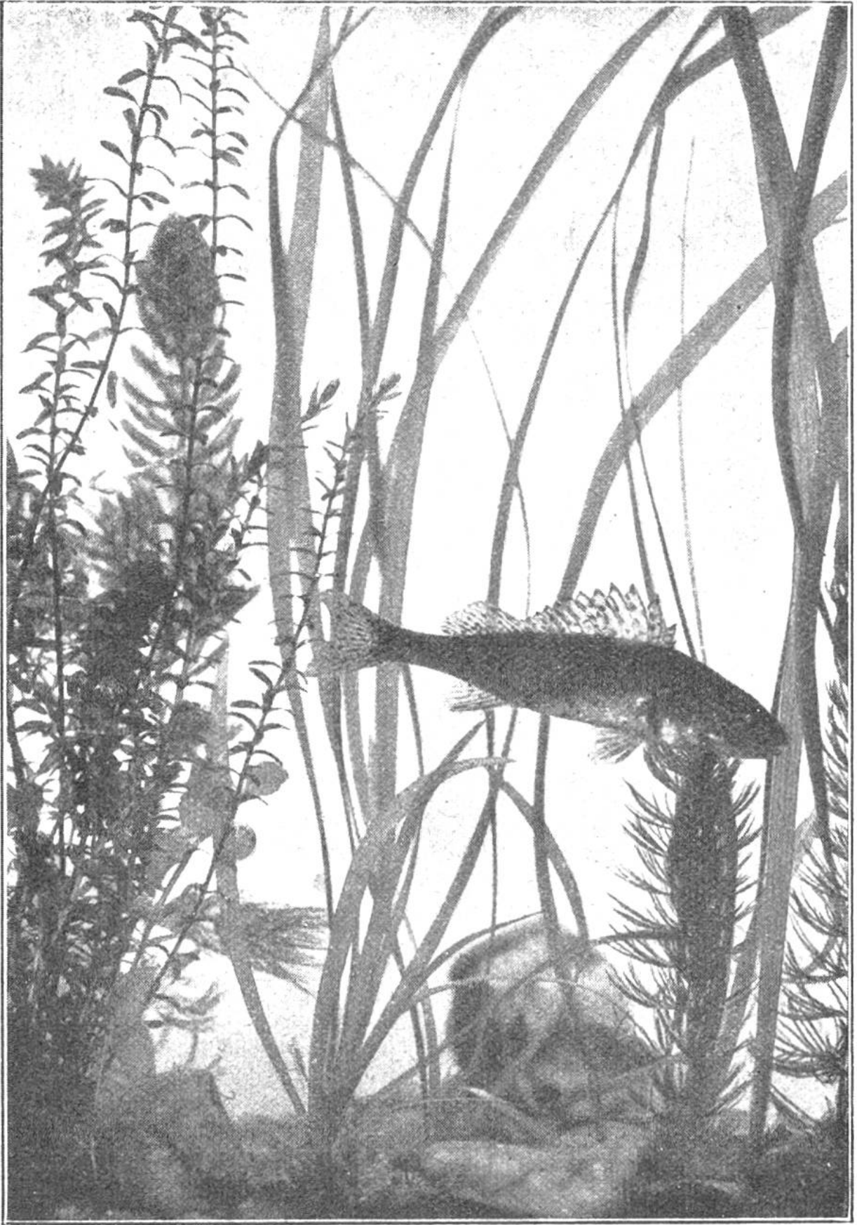
In Fischleins Wundergarten: Kaul- barsch Photographie nach Natur