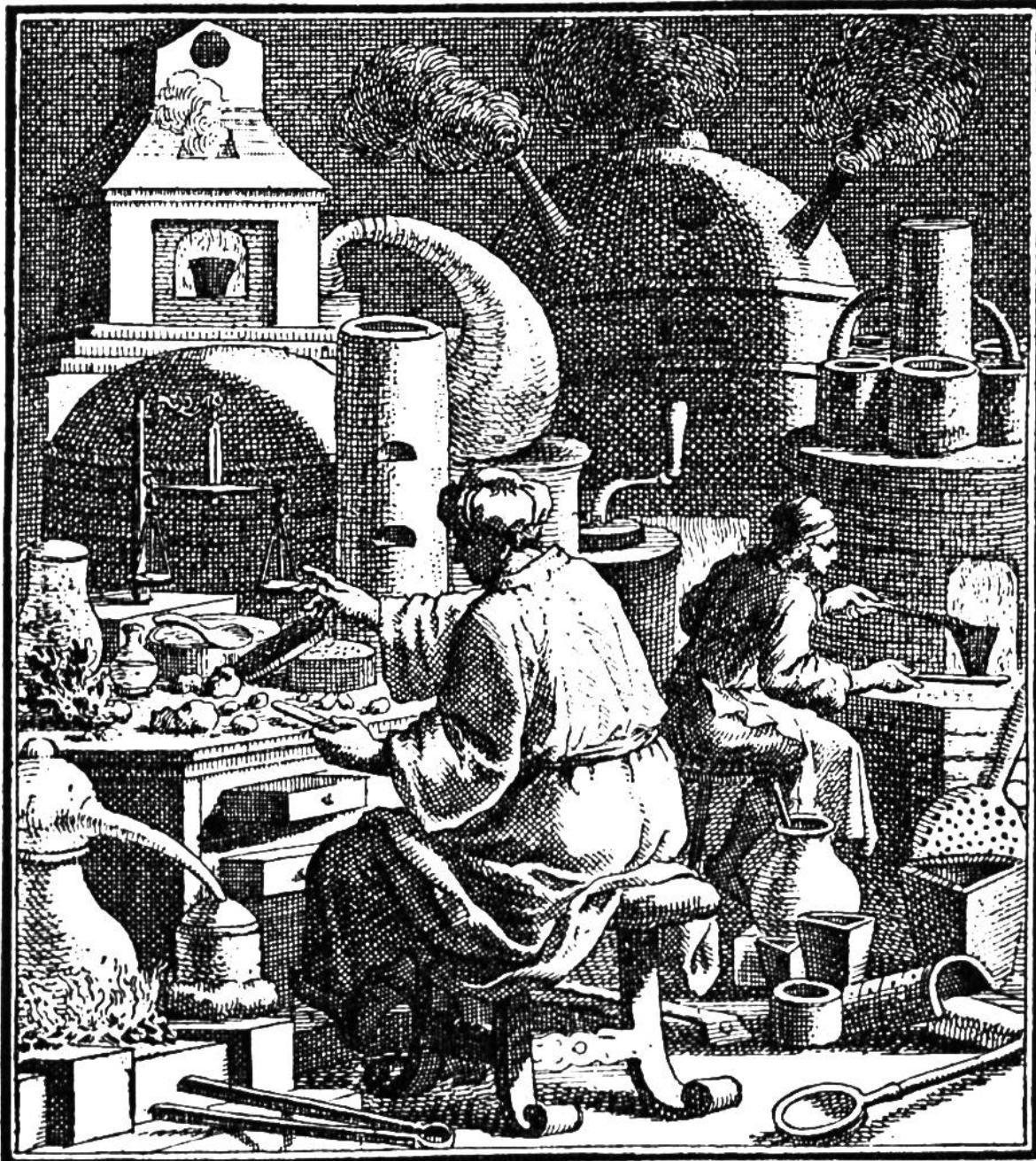
Der Goldmacher in seiner Behausung, umgeben von phantastisch geformten Gefäßen.

gereien Eingang in die Alchimie. Fürstliche Herren suchten ihren durch Mißwirtschaft und Verschwendung bedrohten Haushalt auf bequeme Art wieder herzustellen, indem sie selbst zur Goldbeschaffung Alchimie betrieben oder Leute anstellten, die sich „Alchimisten“ nannten, gewöhnlich aber abgefeymte Betrüger waren.