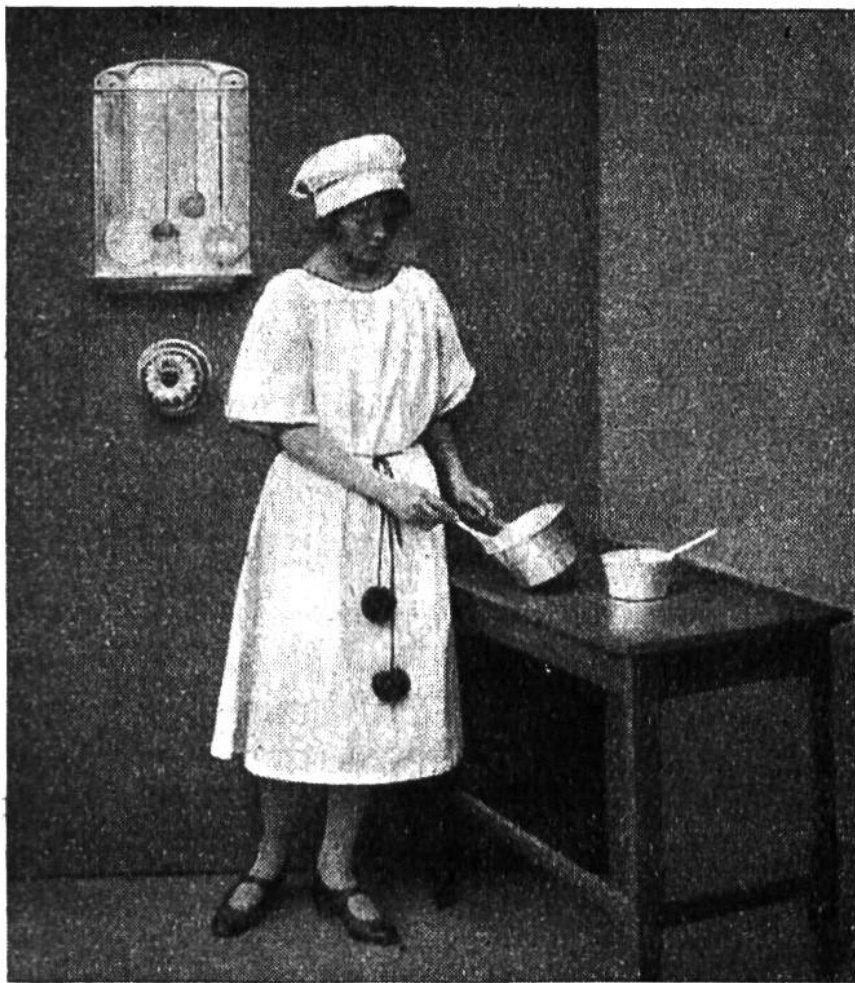
„Hausmütterchen“ in der Küche.

wird genau in derselben Form geschnitten wie die Passe. — Zum Schließen des Cape näht man an der Passe 3—4 Häfen und Öfen an.