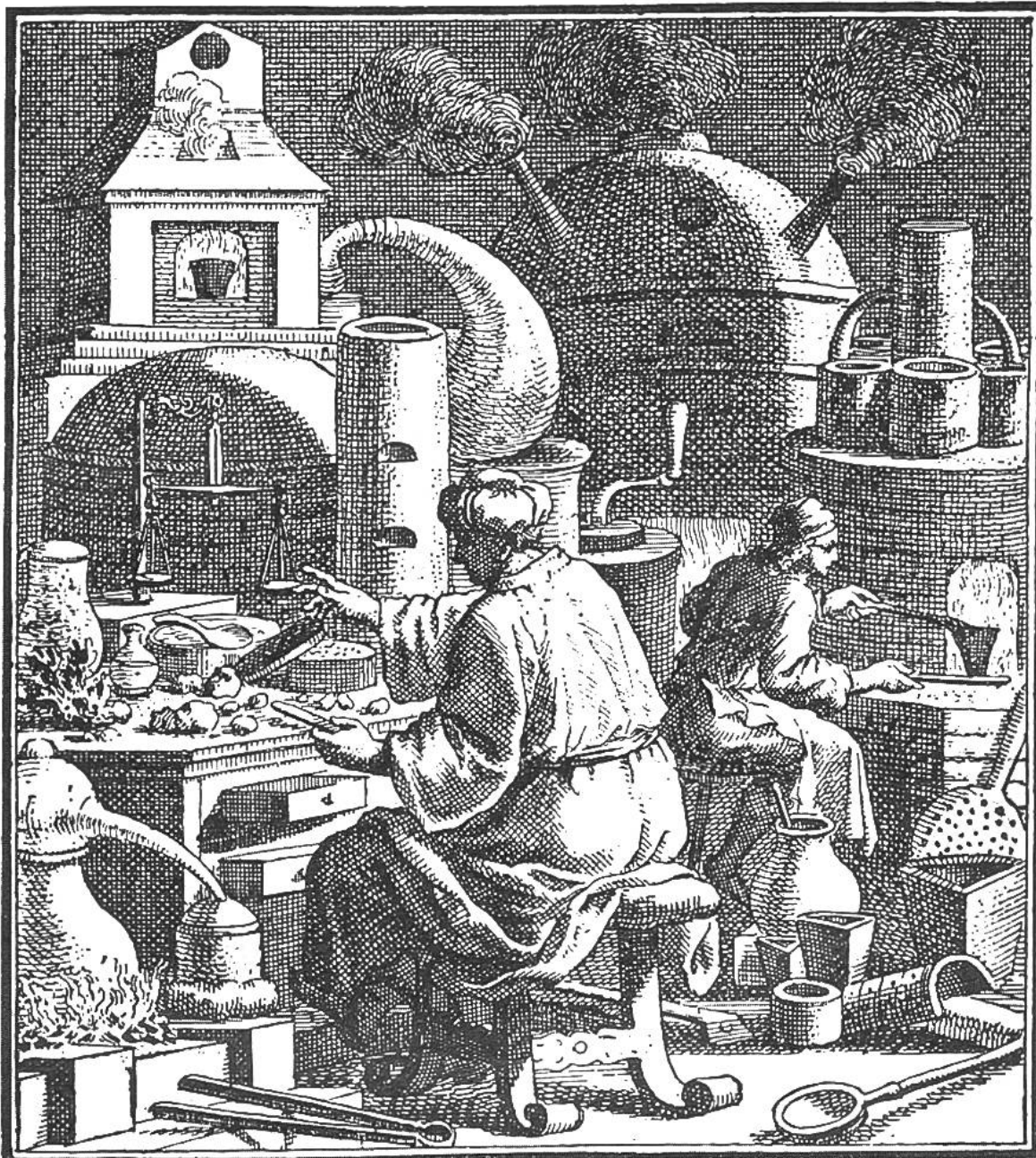
Der Goldmacher in seiner Behausung, umgeben von phantastisch geformten Gefäßen

gereien Eingang in die Alchimie. Fürstliche Herren suchten ihren durch Mißwirtschaft und Verschwendung bedrohten Haushalt auf bequeme Art wieder herzustellen, indem sie selbst zur Goldbeschaffung Alchimie betrieben oder Leute anstellten, die sich „Alchimisten“ nannten, gewöhnlich aber abgefeymte Betrüger waren.