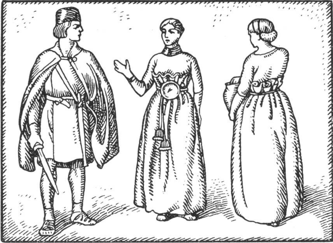
Kleider aus der Pfahlbauzeit.