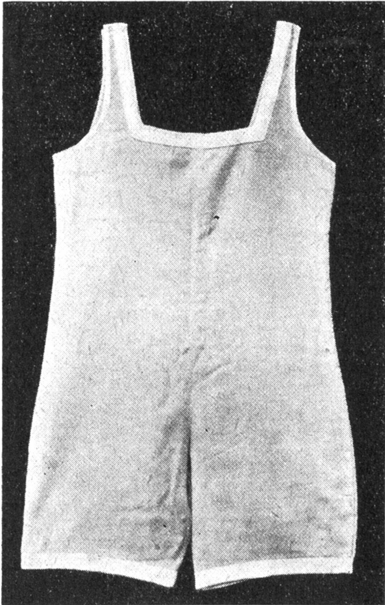
Badekleid mit Achselanschluß.

gestürzt, damit auch die Knopflöcher auf doppeltem Stoff gearbeitet werden können.