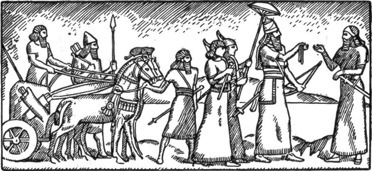
Assyrischer König mit Gefolge.