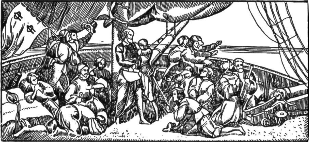
Kolumbus und seine Gefährten angesichts Land.

1481 Stanser Verkommnis, Nikolaus von Flüe als Friedensstifter. Freiburg und Solothurn werden in den eidgenössisch. Bund aufgenommen.