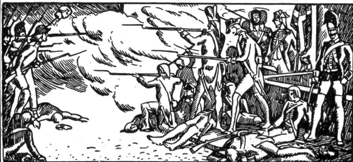
Verteidigung der Tuilerien durch die Schweizergarde.