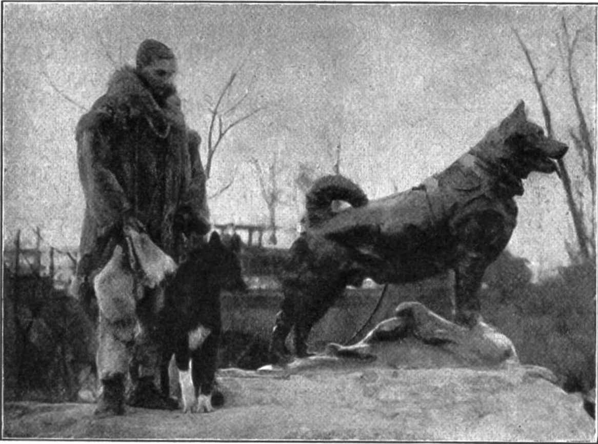
Der tapfere Hund Balto neben seinem Denkmal.