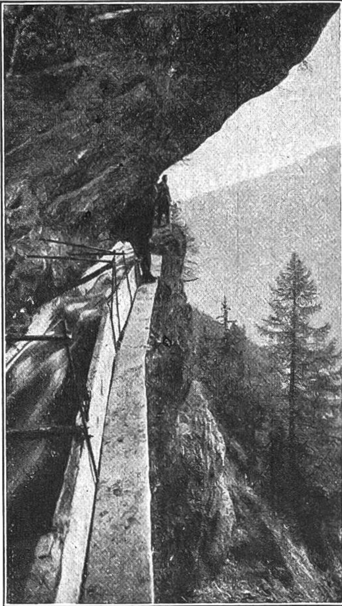
Eine „Suone“ aus dicken Holzbrettern.

der Hammer durch eine Glocke ersetzt. Wenn das Klopfen oder Läu-ten verstummt, so muß der Wächter auf der schlüpfrigen „Ganglatte“ die Leitung abschreiten und den Schaden sofort ausbessern. Er ist übrigens verpflichtet, jeden Tag — bei Regenwetter auch nachts — die Leitung zu begehen, um die Wassermenge auszugleichen und kleine Ausbesserungen zu besorgen. Sein Amt ist verantwortungs- und gefahr- voll.