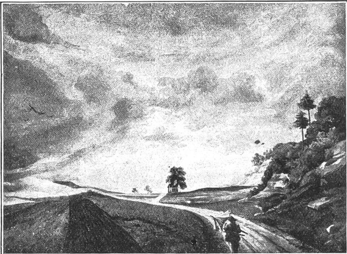
Phantasielandschaft, von Gottfried Keller gemalt. Im Vordergrunde sehen wir Keller selbst, wie er mit seinem Malergerät des Weges zieht.