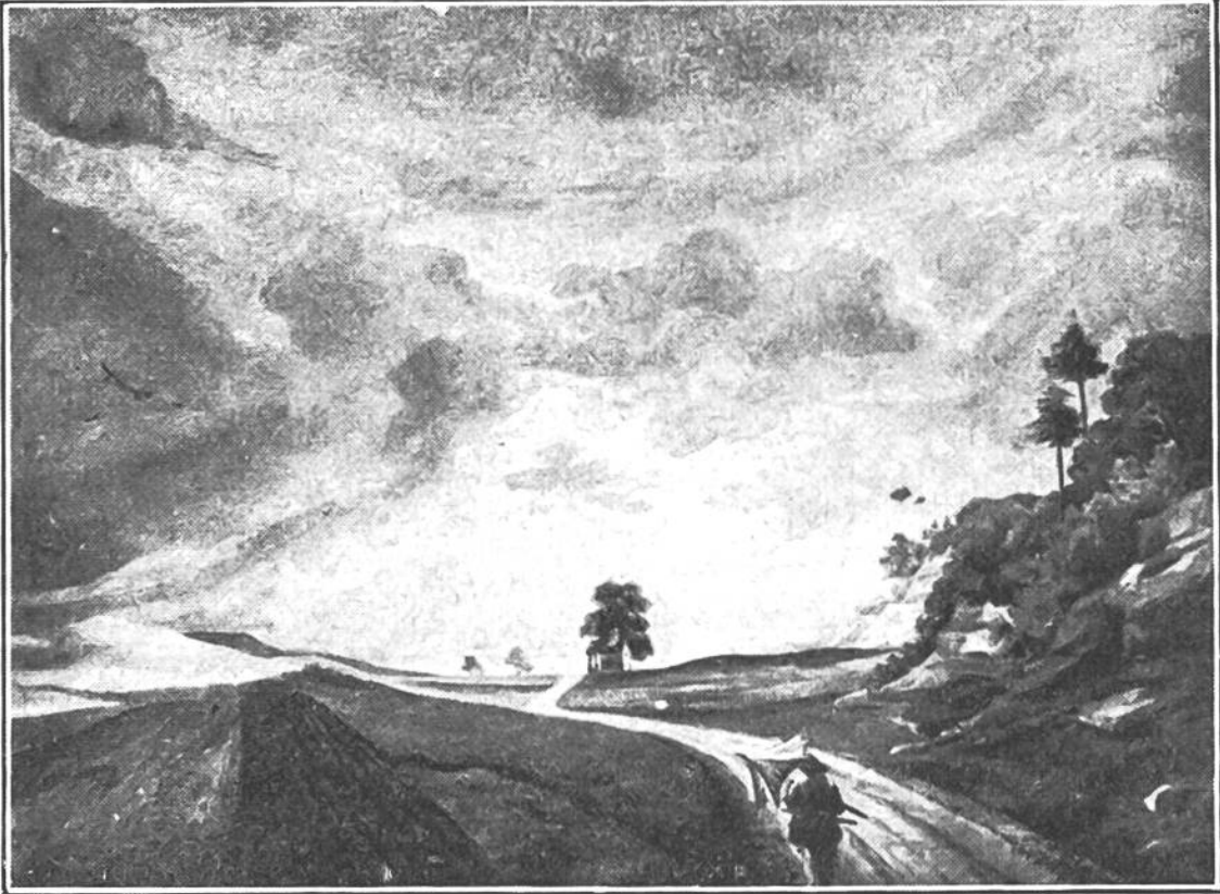
Phantasielandschaft, von Gottfried Keller gemalt. Im Vordergrund sehen wir Keller selbst, wie er mit seinem Malergerät des Weges zieht.