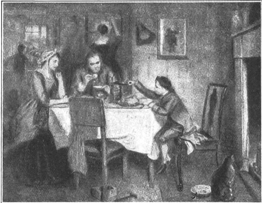
James Watt beobachtet als Knabe den Dampf des Teekessels.