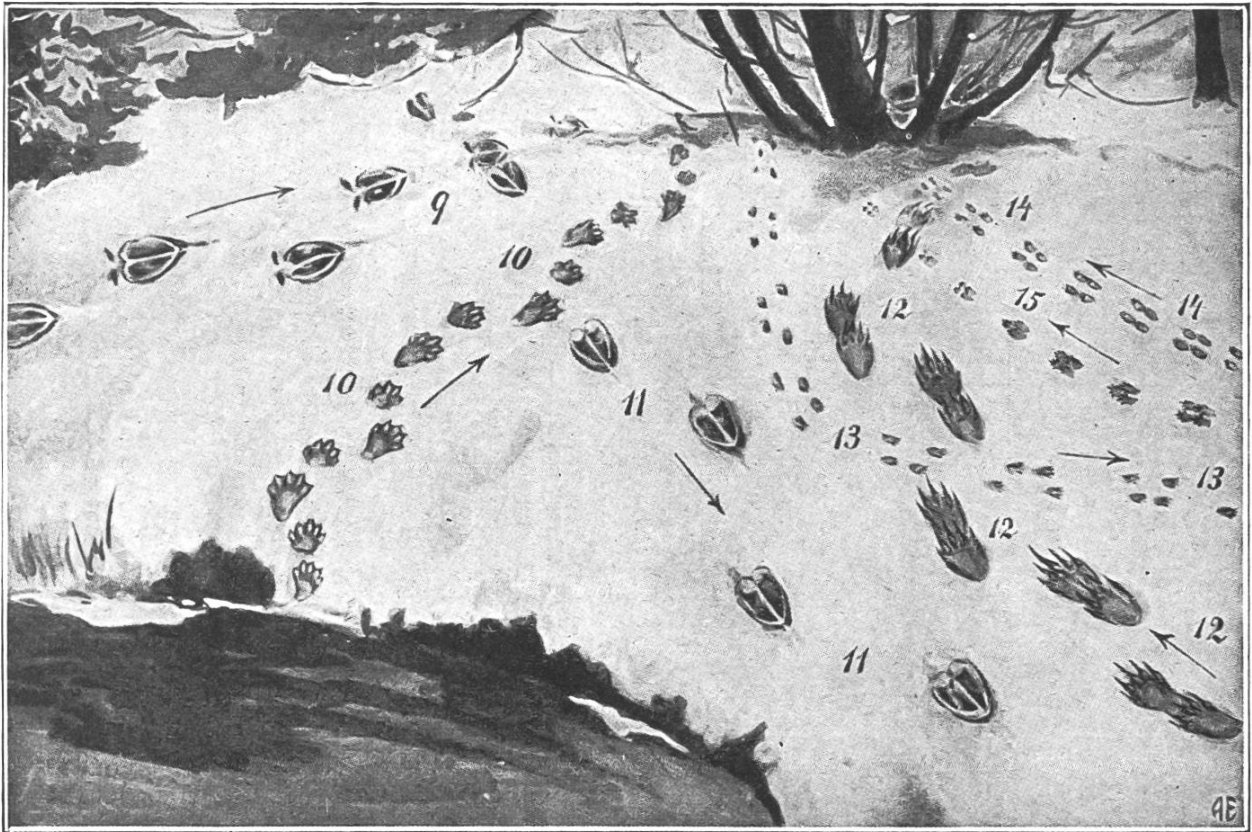
Wildfährten: Spuren im Schnee. 9. Spur des Wildschweins. 10. Fuchshotter. 11. Rotwild (Hirsch). 12. Dachz. 13. Iltis. 14. Wiesel. 15. Marder.