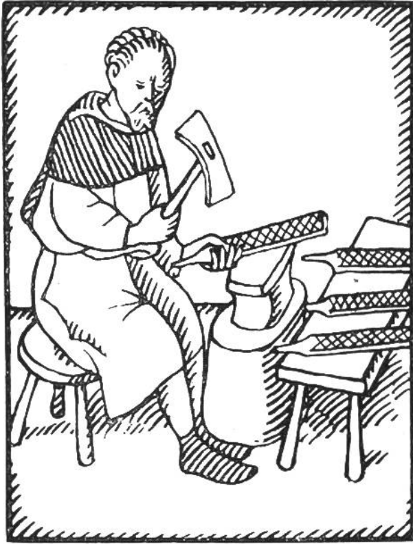
Seilenhauer. (Nach einer Zeichnung aus dem Jahr 1417.)

rauhe Haut dieses Haifisches zum Glätten von Holz und Marmor verwendet, leistete also den Dienst der Seile. Seilen aus Fischhaut sind auch gegenwärtig noch in Gebrauch bei Naturvölkern. Richtige Seilen stellte schon der Bronzezeit-Mensch her, offenbar nach dem Vorbild, das ihm die Natur mit der Fischhaut bot.