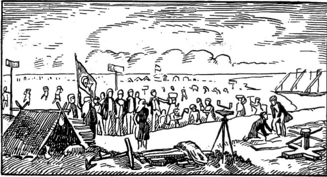
Ferdinand de Lesseps führt am 25. April 1859 in Port-Saïd den ersten Spatenstich zum Suez-Kanal aus.